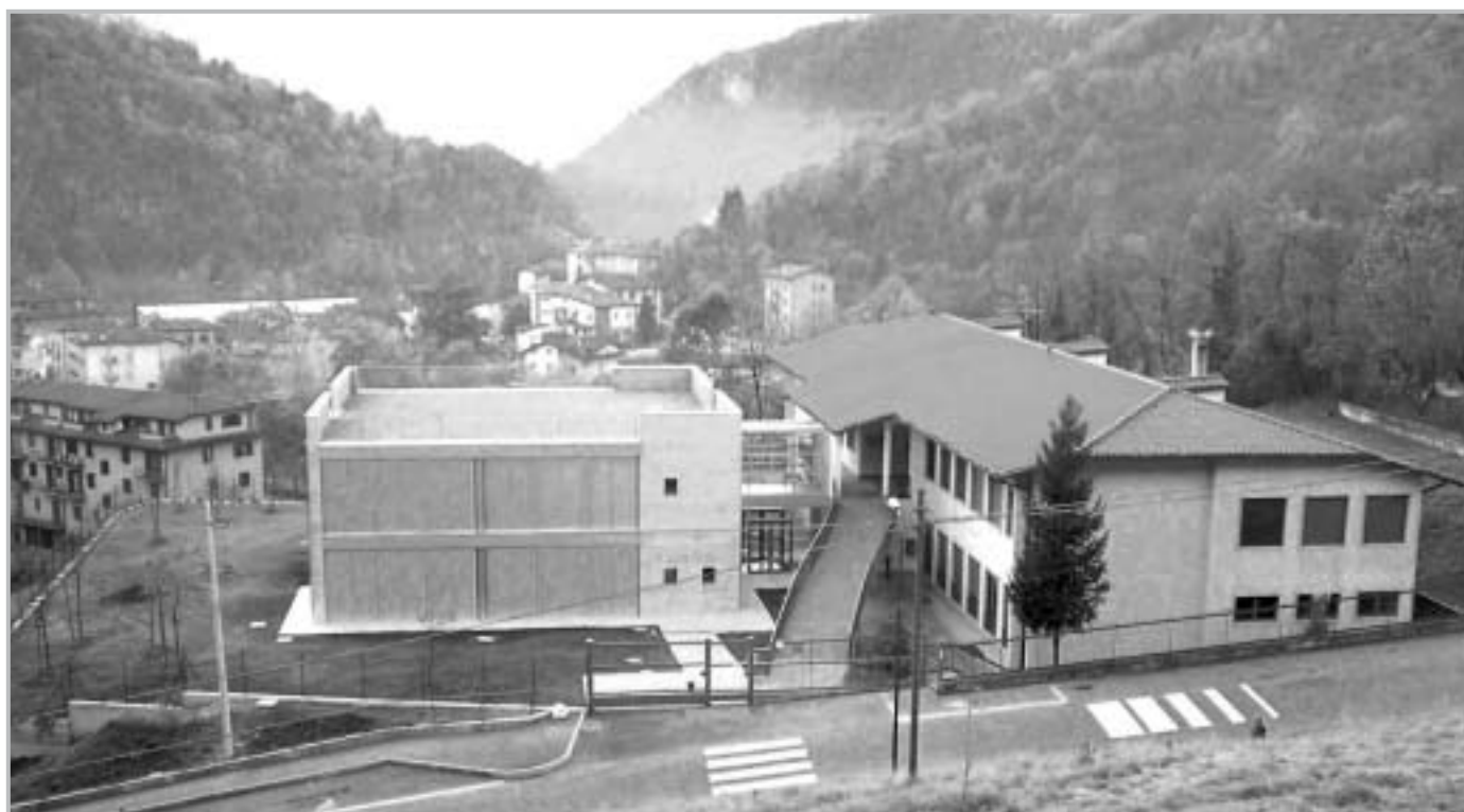
Scuole elementari di Ambria

Animazione alla lettura: Quest'anno le visite in biblioteca degli studenti delle classi seconde della Scuola Primaria si arricchiscono di incontri di "animazione alla lettura" tenuti da un'esperta. Durante gli intrattenimenti i bambini vengono coinvolti nella lettura fino a diventare loro stessi protagonisti del racconto. Il personale