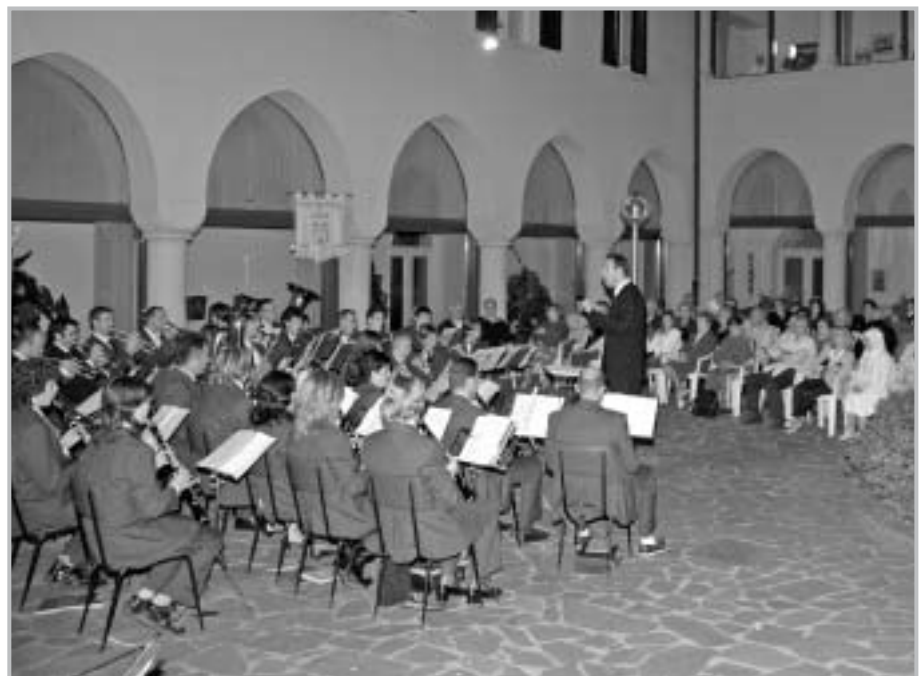
La banda musicale di Zogno nel maestoso chiostro delle suore di Romacolo in concerto per i cittadini di Zogno

Attualmente, con l’approvazione del Piano di Zona 2006/2008, che ha evidenziato una nuova politica di gestione dei servizi, più attenta al soddisfacimento dei bisogni, sono state attivate sul territorio una serie di offerte.