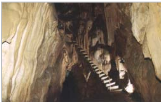
Le grotte delle meraviglie: il salone centrale con scala anni "40"

Le Grotte delle Meraviglie stanno per avere un nuovo accesso sicuro per i visitatori, in sostituzione di quello che fu realizzato settanta anni orsono. Il progetto prevede la costruzione di un nuovo sentiero di accesso alle Grotte (110.000€) che passerà sopra la galleria dell'ex statale. A seguito di alcuni smottamenti avvenuti la primavera scorsa, il progetto è stato rivisto così che la zona circostante sarà messa in sicurezza per l'eventuale caduta di massi, e all'interno verrà adeguato l'attuale impianto di illuminazione. Inoltre poiché il vecchio sentiero è stato interessato da un rilevante smottamento causato dal cedimento del vecchio muro a secco, sono stati stanziati ulteriori 65.000€ al fine di rimettere in sicurezza anche questa parte del percorso, che sarà la continuazione di quello nuovo. Nell'area ex-Falk è stato sistemato l'impianto di fognatura (75.000€) che, essendo troppo vetusto, presentava problemi idrici e igienico-sanitari. Questo intervento sarà seguito da un altro (50.000€), interessante la zona prossima alla centrale Enel.