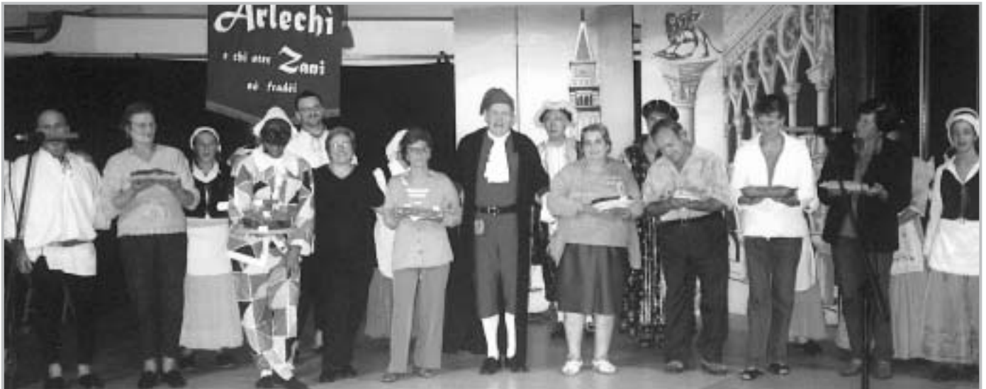
Momento aggregativo della Settimana della 3° età, dove gli ingredienti di una buona torta casereccia unitamente al folclore nostrano, hanno rallegrato una “magica” serata.