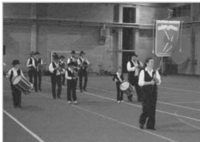
I baghecc de Bèrghem (cornamuse)

I numerosi spettatori presenti hanno assistito alle esibizioni degli oltre cento appassionati che hanno frequentato il corso gratuito di danze popolari organizzato appositamente per animare il Solstizio d'estate zognese che sarà riproposto anche l'anno prossimo.