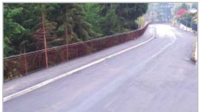
Nuovo marciapiede in Via Ronco - Endenna

Sono già stati appaltati i lavori per la realizzazione di un'ulteriore tronco di collettamento fognario (35.000€) per la contrada di Camanghè. Il centro della frazione sarà interessato da un intervento di riqualificazione e di messa in sicurezza con una spesa prevista di 150.000€.