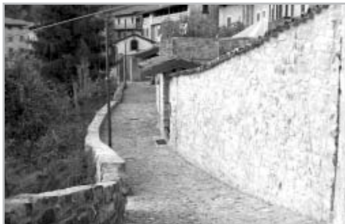
Riqualificazione Contrada di Grimolto

La contrada di Grimolto è stata interessata da un recupero architettonico ambientale (50.000€), con la riposizionatura dell'antico selciato, e la sostituzione con un'integrazione dei punti luce esistenti.