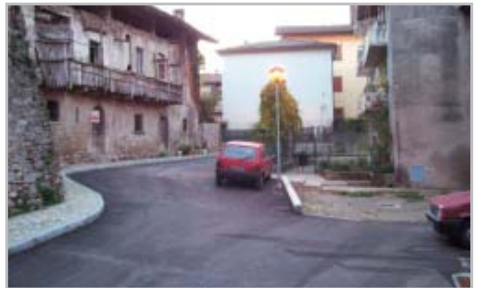
Centro storico di Stabello