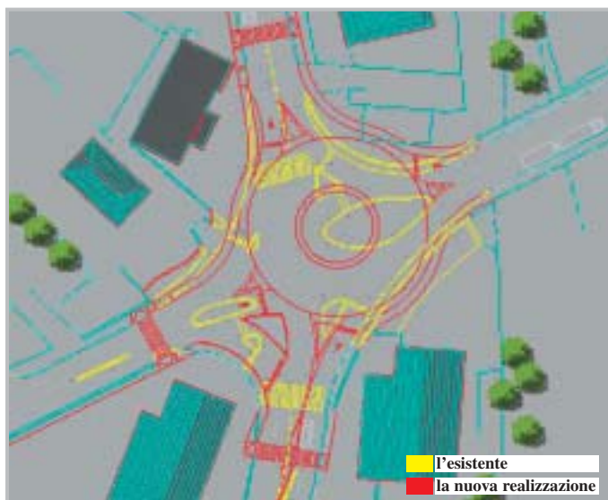
Progetto rotondella al Ponte Nuovo