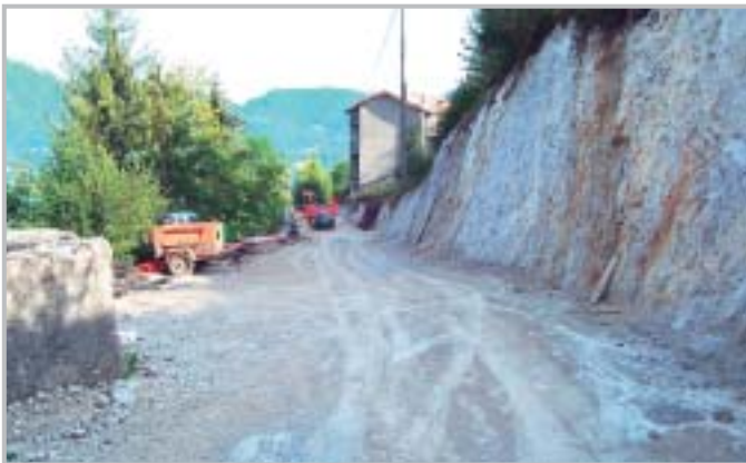
Strada del "Tiglio"

nuovo tratto di fognatura nella località delle Cornelle (100.000€), mentre la strada di collegamento con la contrada del Tiglio (260.000€), è già in fase avanzata di realizzazione.