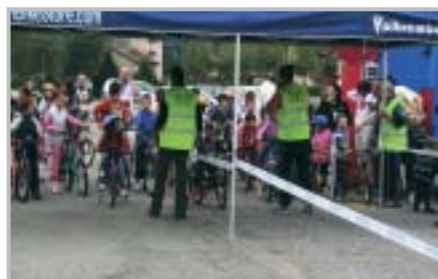
Biciclettata in famiglia