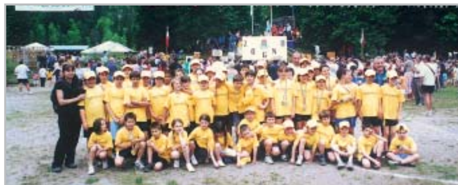
Olimpiadi di Valtorta