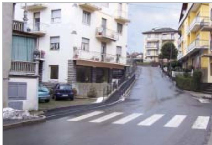
Marciapiedi scuole Endenna