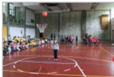
Giornata del gioco

L'Assessore allo sport condivide pienamente quanto espresso dal Presidente, e per quanto di competenza continuerà a fare la sua parte.