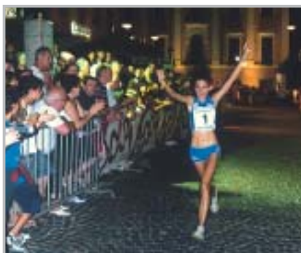
Corrida di San Lorenzo

I l 2008 ha visto "Zogno sportiva e del tempo libero" in prima fila nell'organizzare gare e manifestazioni di grande livello agonistico e aggregativo.