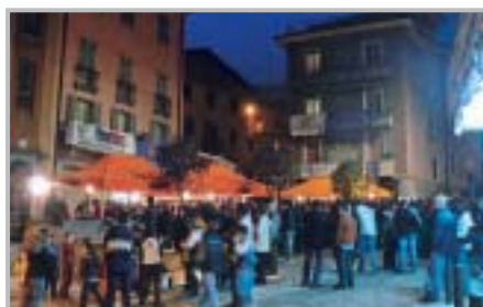
Festa della neve