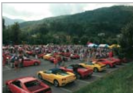
Le Rosse in Valle