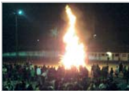
Casada de mars