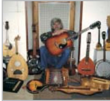
Omaggio ai cantautori