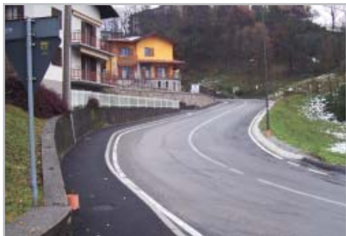
Marciapiedi scuole Ambria

A settembre è stato aggiudicato l'appalto per la Gestione Calore degli edifici di proprietà comunale: l'offerta della ditta aggiudicataria prevede, oltre alla gestione in toto degli impianti per nove anni, la sostituzione di quasi tutte le caldaie, con altre a condensazione, la modifica degli impianti delle scuole di Endenna e di via San Bernardino, alimentati ancora a gasolio con impianti a metano, la realizzazione di due impianti fotovoltaici, due impianti di pannelli solari termici, un sistema di riscaldamento a sonde geotermiche con una pompa di calore. Tutti gli impianti saranno dotati di sistema di telecontrollo.