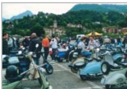
Moto d'epoca: 2° Trofeo Comune di Zogno