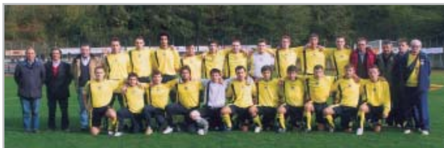
Polisportiva Zogno 98 - Squadra 2ª Categoria