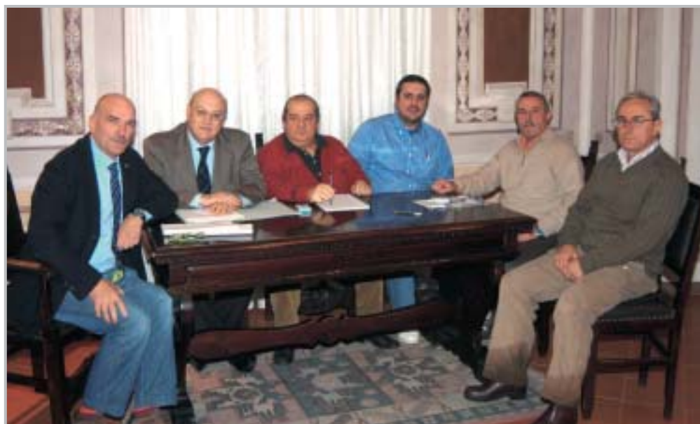
Il Sindaco e la Giunta