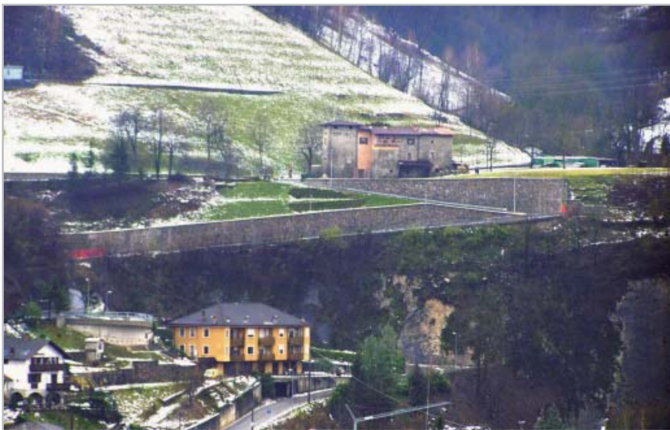
Strada Stabello-La Corna