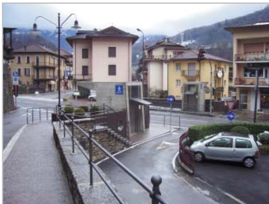
Sottopasso 5 Vie e via Pogliani

Sono in corso anche i lavori per la riqualificazione stradale della contrada di Tessi a Spino e di via Furietti. Inoltre con un intervento di 73.000, si sta dotando anche le contrade del Tiglio, Cornelle, Colle, Prato grande di Poscante, via Spino, via Bregni di Somendenna ed un tratto di via Ere a Stabello, di nuovi impianti di illuminazione pubblica.