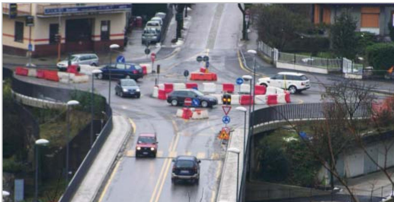
Rotatoria al Ponte Nuovo