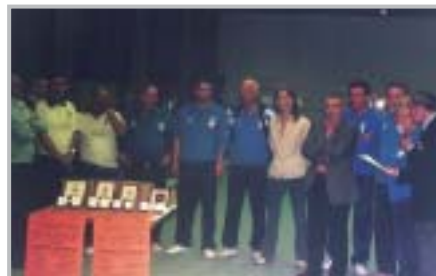
Bocce: 6° Trofeo Comune di Zogno