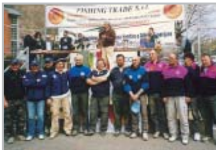
Coppa Italia di Pesca