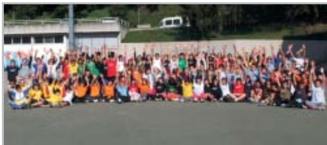
Giocalosport Scuola Secondaria