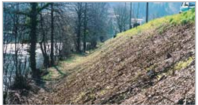
...e dopo la giornata ecologica