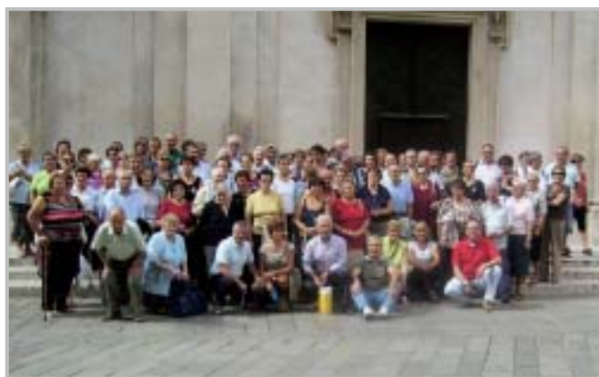
Settimana terza età: la Messa e la gita a Savona

La vita media di ognuno di noi si allunga. Tuttavia, frequentemente, gli anni guadagnati sono appesantiti da cattiva salute, malattie croniche ed inabilità. La prevenzione di questa cattiva qualità della vita in terza età si ottiene cercando di modificare i comportamenti già durante la vita attiva. Con questa campagna lanciata dall'ASL, che ha visto l'adesione del Comune di Zogno, si è inteso promuovere quelle azioni comportamentali che agiscono fortemente sul benessere e sulla salute della