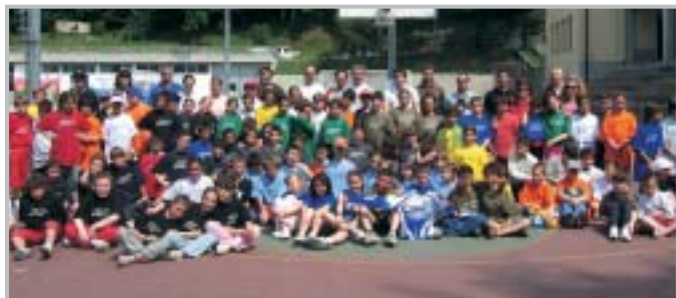
Giocalosport Scuola Primaria