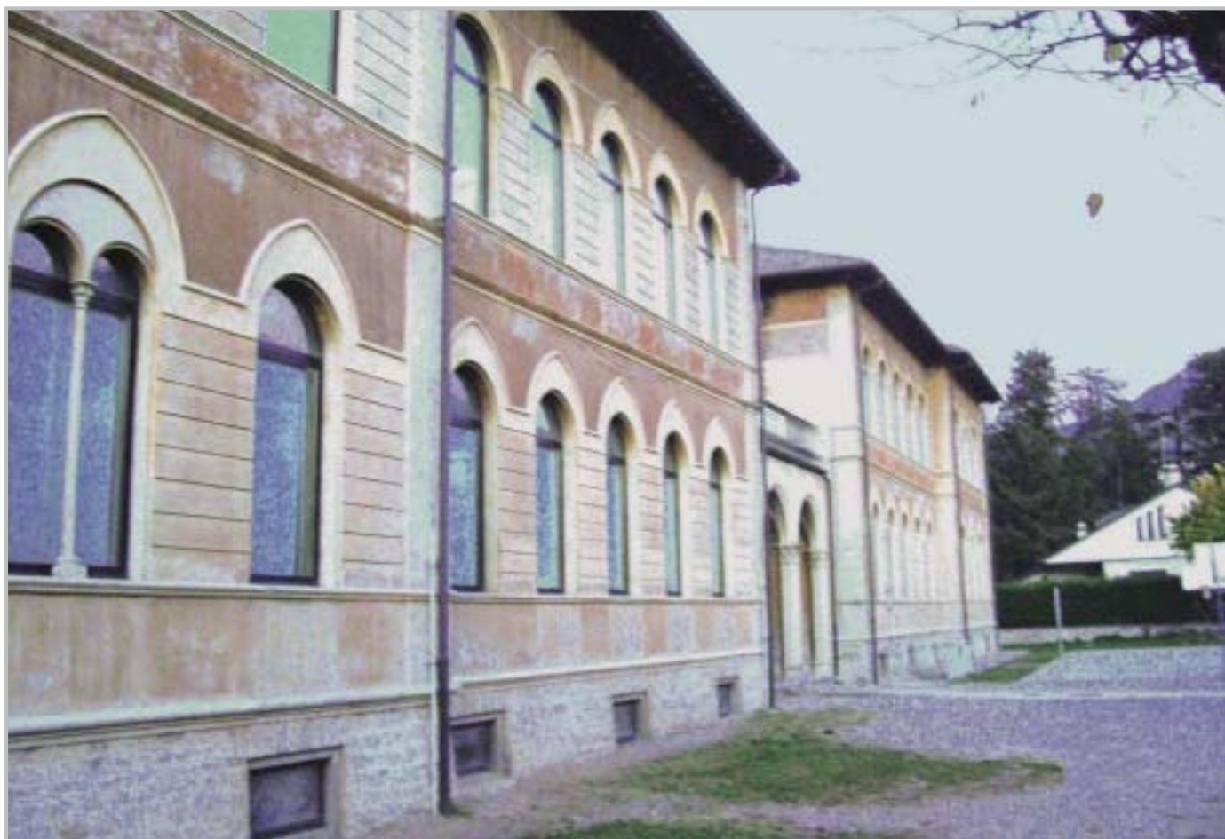
Scuole Pietro Ruggeri

Le scuole dell'Infanzia Paritarie sono state sostenute nell'ampliamento della loro Offerta formativa con ulteriori e complessivi € 26.000.