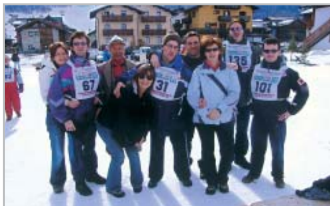
I due momenti in collaborazione con "Non solo sogni": la pesca al Laghetto Brembilla e le Olimpiadi di Livigno