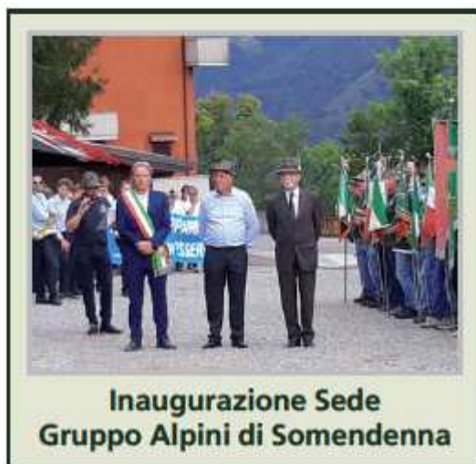
Inaugurazione Sede Gruppo Alpini di Somendenna

È stato effettuato un intervento di manutenzione ordinaria dei muri e delle lapidi di ferro, posizionati lungo la scalinata del cimitero, in ricordo dei caduti della prima guerra mondiale.