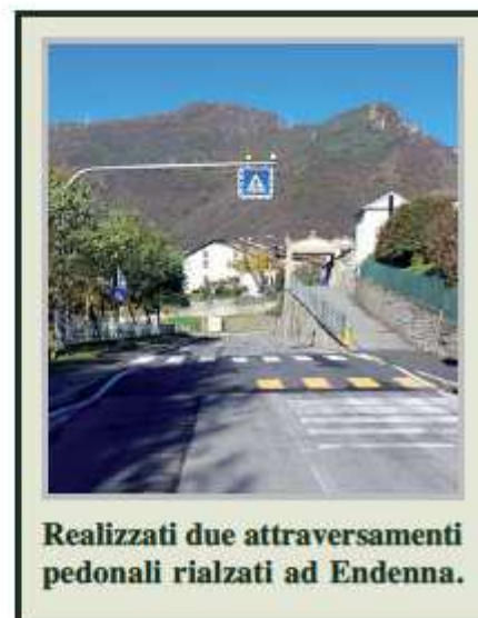
Realizzati due attraversamenti pedonali rialzati ad Endenna.