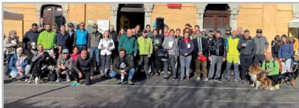
A sinistra: Festa del Volontariato 2023. Consegna Bandiera del Volontariato all'Associazione Non Solo Sogni A destra: Mia cor, basta rià. Camminata non competitiva nell'insieme di eventi del Mese della Salute Mentale