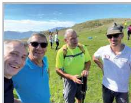
Natura Senza Barriere. Una Montagna per tutti