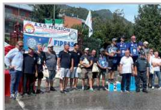
Campionato italiano di Pesca