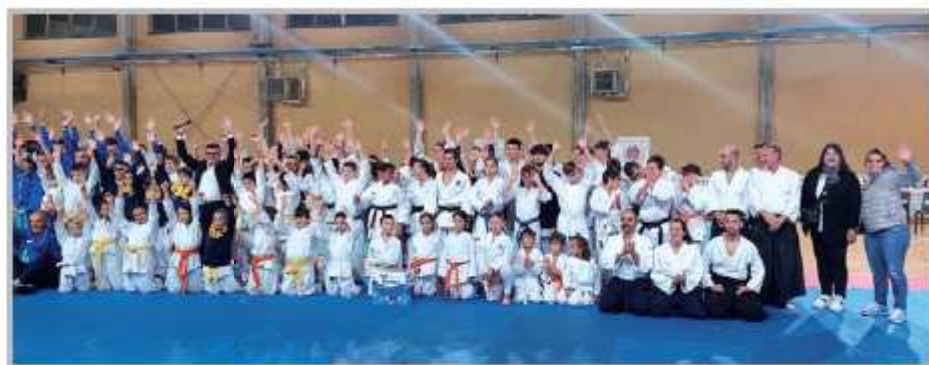
Serata arti marziali per Telethon