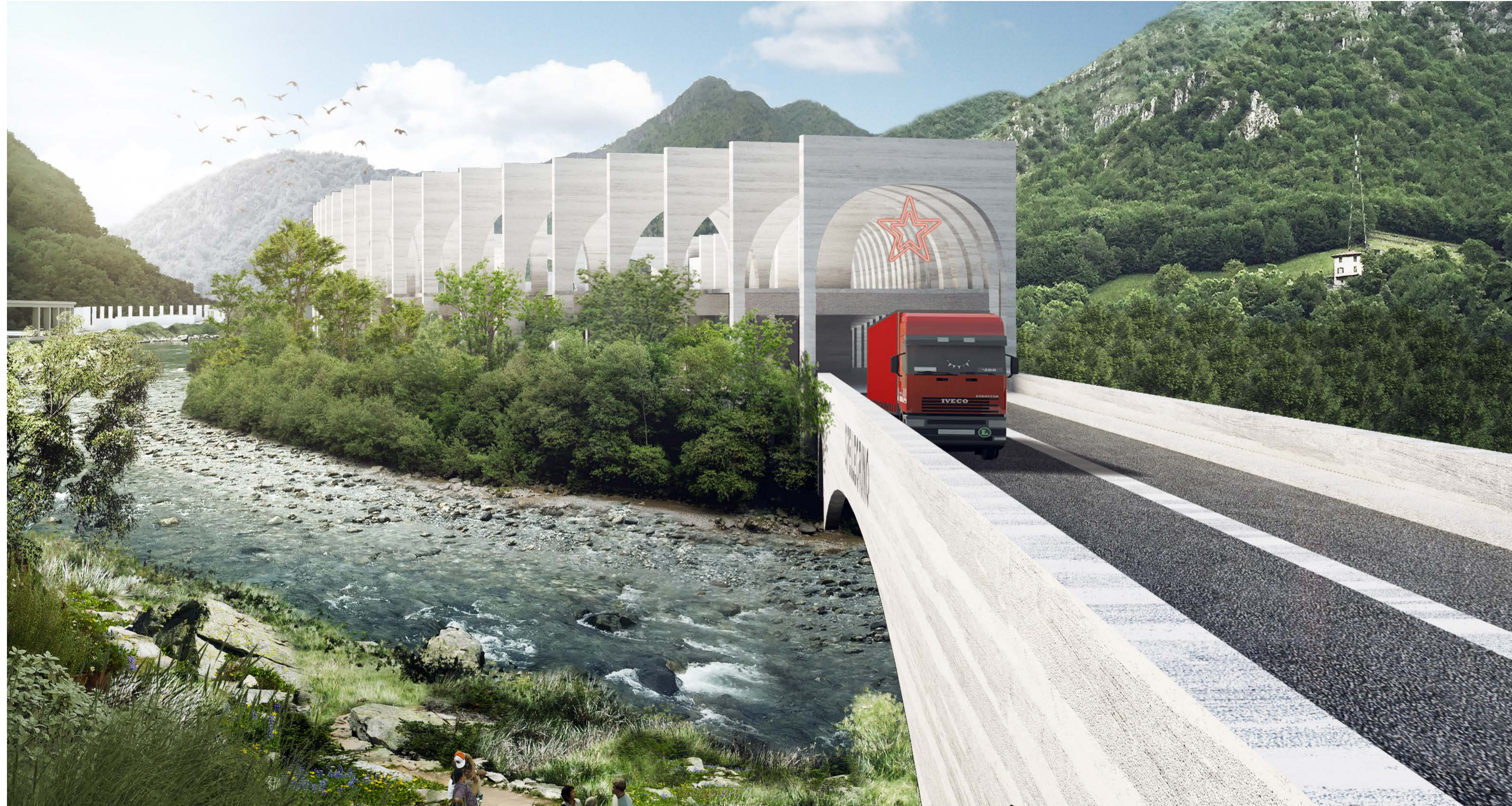
3 VISTA DA NORD