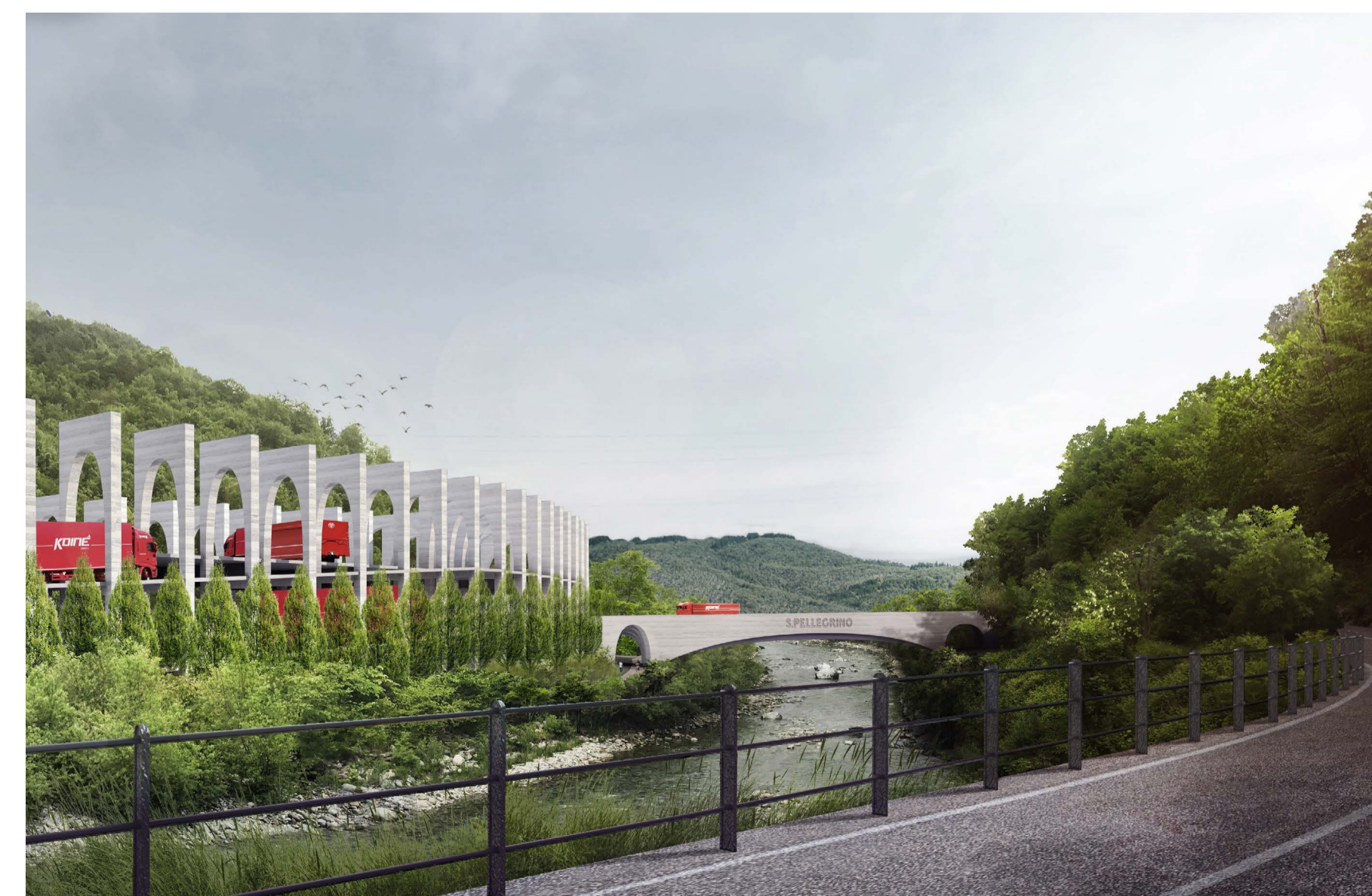
2 VISTA DA NORD