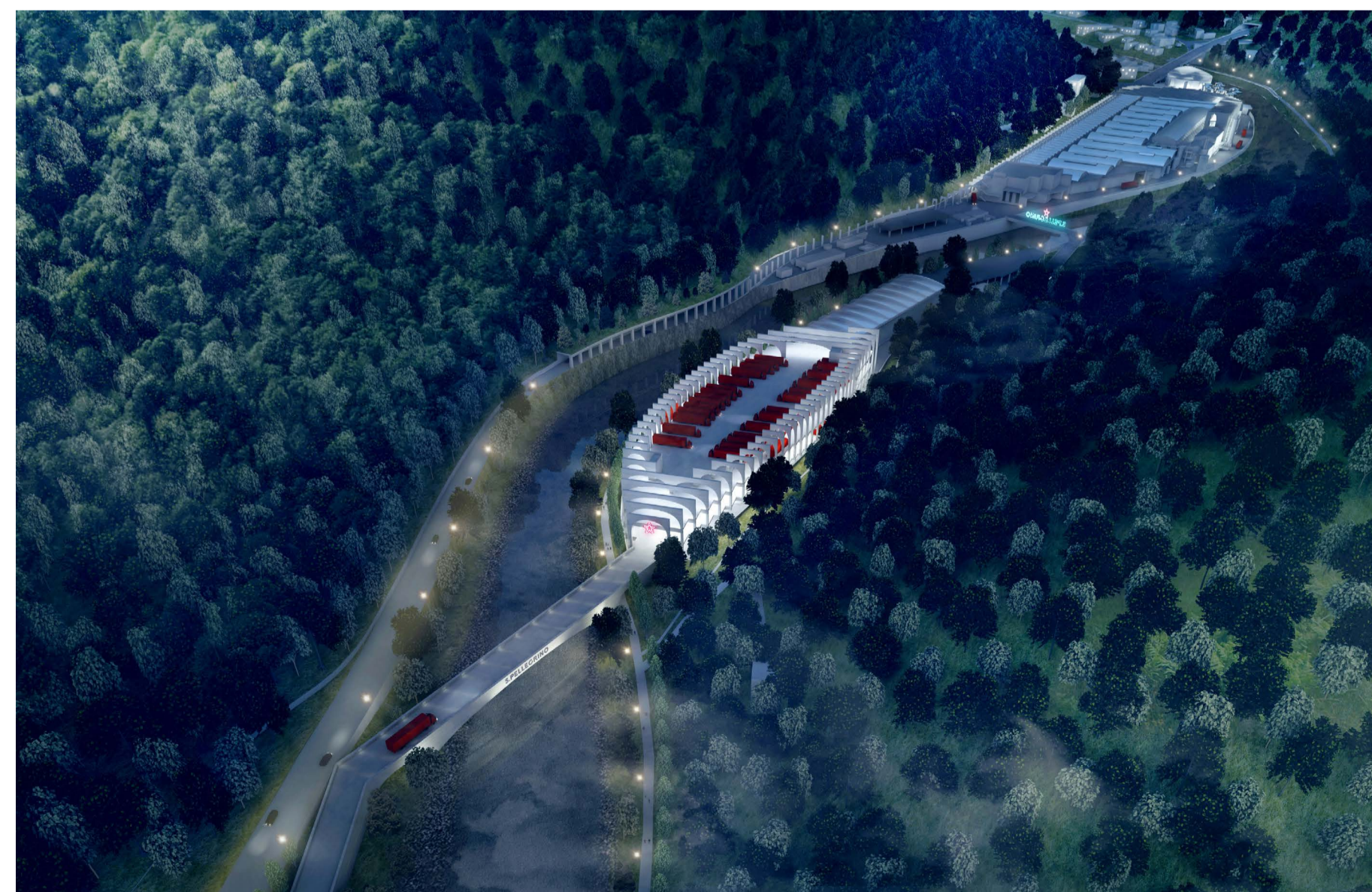
1 VISTA AEREA DA SUD