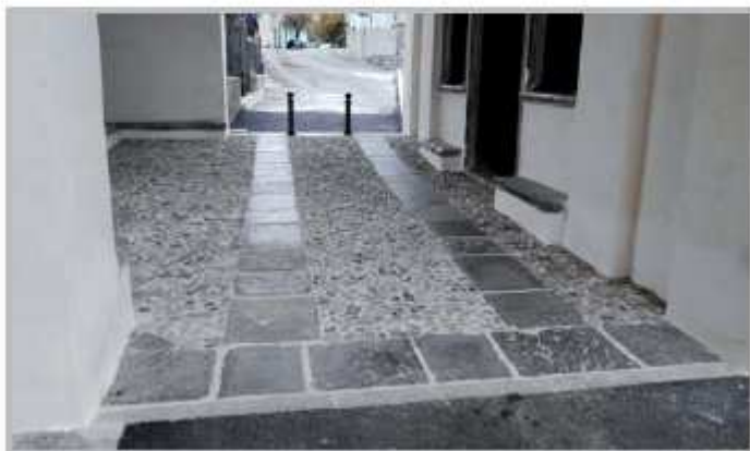
La pavimentazione nei pressi del portico della chiesa della Foppa