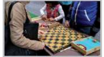
25 Aprile - I Giochi di Una Volta