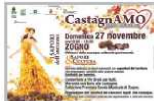
27 Novembre - CastagnArno