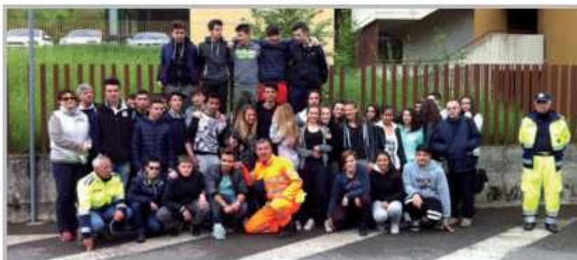
Pulizia area verde Istituto Tuoldo

La raccolta differenziata ed il riciclo fanno oramai parte della nostra quotidianità ed è per questo che anche per l'anno scolastico 2015/16, si è voluto coinvolgere gli alunni delle scuole dell'infanzia, primaria, secondaria di primo e secondo grado attraverso una serie di incontri formativi e di sensibilizzazione per contribuire alla tutela dell'ambiente e al decoro urbano.