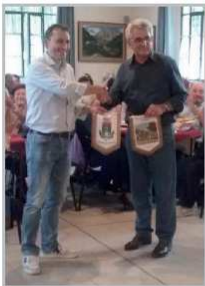
Salsomaggiore Terme 2016 (Gazzettino di Parma)