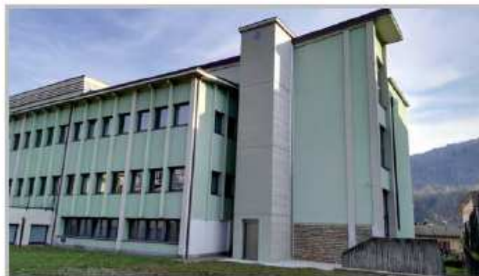
Il nuovo ascensore per l'accesso alla sala polivalente

È doveroso ricordare inoltre il costante impegno e le risorse finanziarie che vengono impegnati per la manutenzione ordinaria del patrimonio, realizzati sia con affidamenti ad imprese esterne sia grazie alla preziosa collaborazione della squadra manutentiva, che anche quest'anno hanno riguardato in particolare interventi sugli edifici scolastici, la manutenzione delle pavimentazioni del centro storico, gli interventi di manutenzione e di pulizia della rete viaria, oltre a tutti gli interventi di supporto all'organizzazione delle numerose manifestazioni che vengono svolte soprattutto durante il periodo estivo. Continua anche l'importante impegno economico (40.000,00