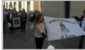
19 Marzo - Volontariato in piazza