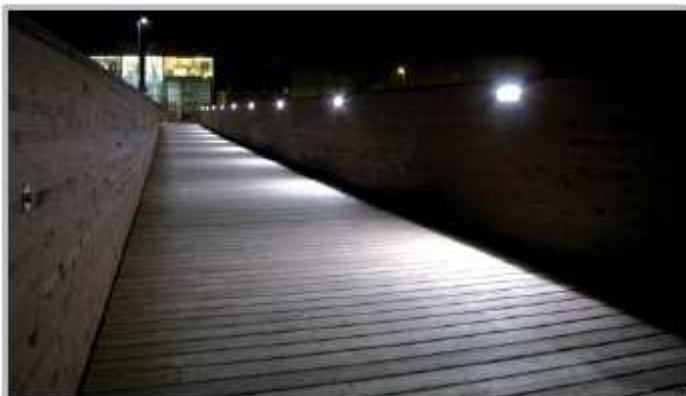
L'illuminazione del nuovo ponte della pista ciclabile

presso l'edificio che ospita le scuole secondarie di primo grado in piazza Marconi, con una spesa di 90.000,00 euro , è stato installato un nuovo ascensore e sistemati i percorsi esterni per consentire anche alle persone con difficoltà motorie di accedere all'ultimo piano dell'edificio dove è situata la sala riunioni polivalente. L'ascensore, serve tutti i piani dell'edificio, essendo collocato in prossimità della scala sul lato ovest dell'edificio ed avendo anche un accesso esterno, può essere utilizzato in modo indipendente rispetto all'apertura del plesso. Per il vano ascensore si è scelto di adottare una struttura completamente in cemento armato, per garantire un buon inserimento in rapporto alla struttura esistente e per minimizzare i costi di manutenzione, particolarmente elevati soprattutto per le strutture vetrate. Oltre a questo intervento, sono stati investiti 46.000,00 euro per la manutenzione straordinaria degli edifici scolastici con interventi che hanno interessato sostanzialmente tutti i plessi scolastici.