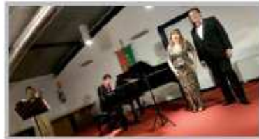
1 Gennaio - Concerto di Capodanno