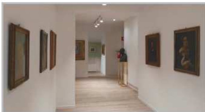
Una delle sale della nuova pinacoteca