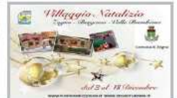
3-18 Dicembre - Mercatini di Natale e Animazione