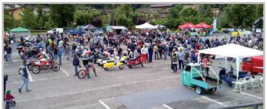
10° Raduno moto d'epoca