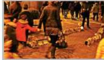
31 Marzo - Casà fò Mars - La Tirada di Tole