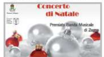
23 Dicembre - Concerto di Natale