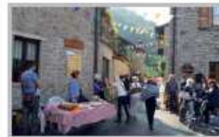
2 Ottobre - Expo Martina