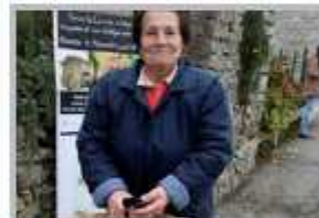
13 Novembre - Castagnone e i suoi sapori