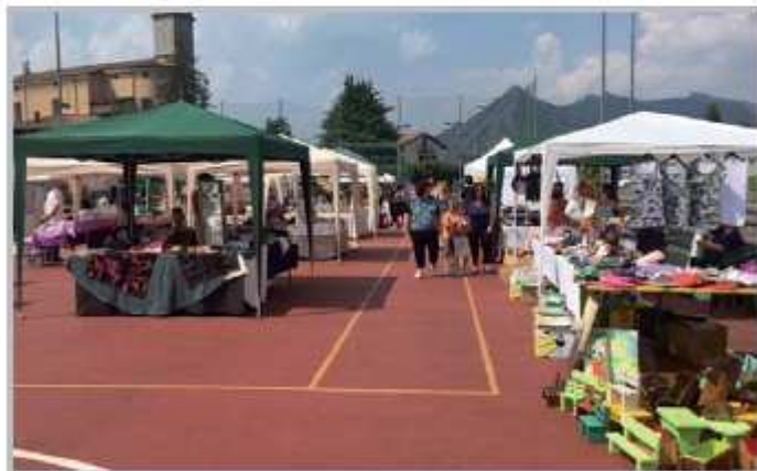
10 luglio 2016 "Invento, Creo, Recupero..."