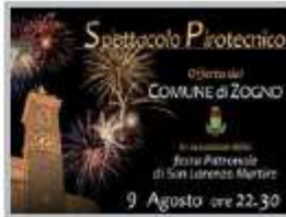
9 Agosto - Spettacolo Pirotecnico