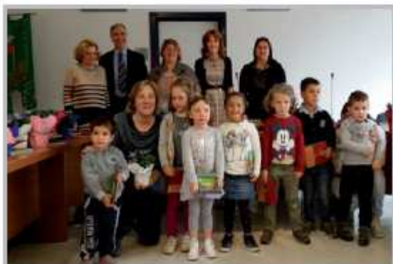
Mostra Concorso Ristoffiamo