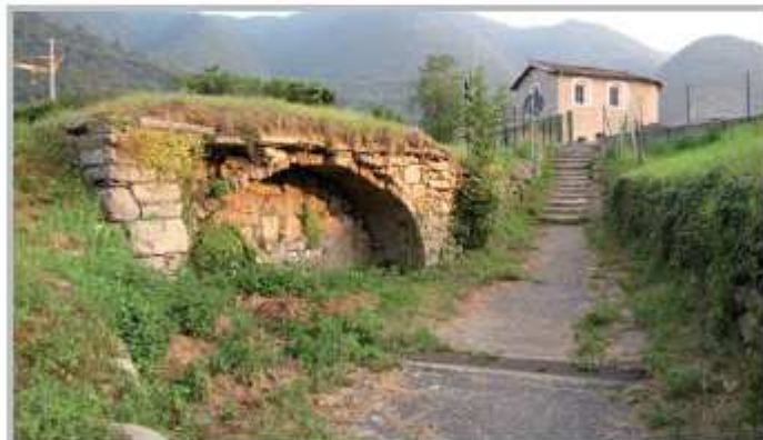
La fontana dei Mortini nei pressi del cimitero di Stabello

Il manufatto si presenta con forme molto semplici, due murature in pietrame abbozzato sorreggono una volta in mattoni a sesto ribassato, che sommonta una vasca in pietra seminterrata. La tipologia costruttiva rispecchia le caratteristiche tipiche dell'epoca,