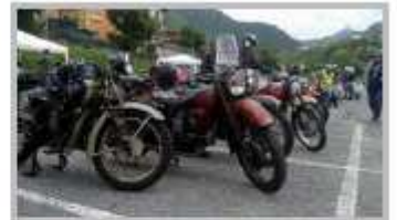
19 Giugno - 10° Raduno Moto d'epoca