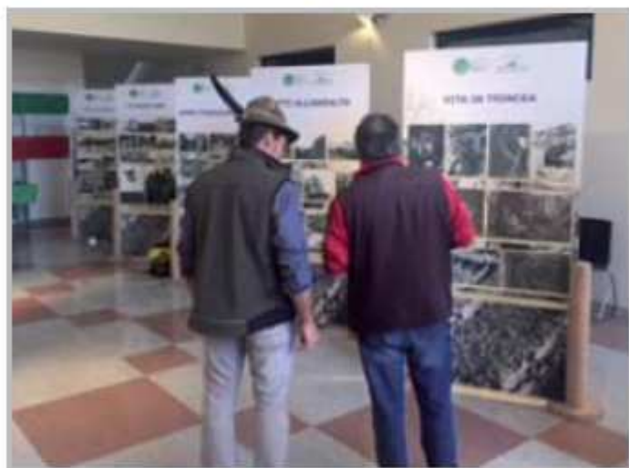
Inaugurazione e mostra fotografica del Gruppo Alpini di Zogno sulla Grande Guerra in occasione del centenario della prima Guerra Mondiale

In questi 12 mesi sono state fatte moltissime cose, con la certezza e l'obiettivo di condividere l'atmosfera di vivacità che ha caratterizzato quest'anno all'interno della nostra comunità Zognese. Tra gli intenti delle nostre attività a carattere culturale evidenziamo l'aggregazione e il divertimento un modo di operare per il bene comune, la valorizzazione e spazio alle associazioni del nostro territorio, la valorizzazione di eventi del passato e del presente del nostro territorio ed i concerti locali, feste e tradizioni popolari.