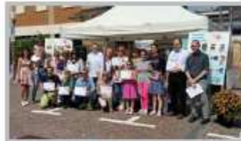
22 Maggio - Viale in fiore