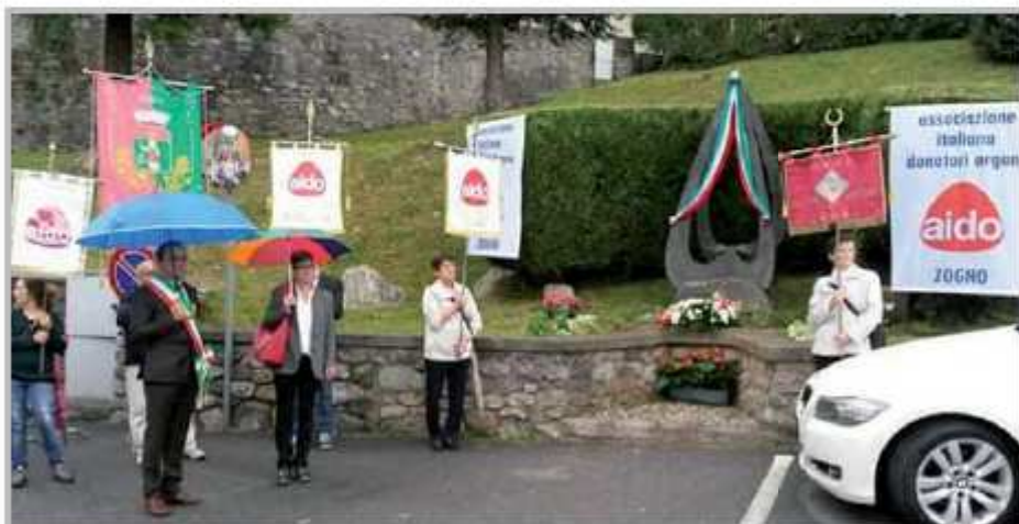
Anniversario AIDO Volontariato 2016

Festa della Terza Età che si è conclusa con il classico e sempre piacevole spettacolo dei burattini in piazza Garibaldi rappresentato della compagnia "Il Riccio" che ha visto unite le generazioni dei Nonni con quella dei Nipoti sulle gradinate della chiesa, un anfiteatro naturale per ricordare ai nostri bimbi, quanto è bello vivere le piazze, sederci sopra e farle diventare un vero e proprio luogo di aggregazione.