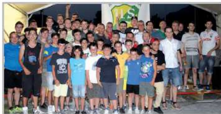
40° anno di fondazione dell'Asd Endenna, con riconoscenza e gratitudine