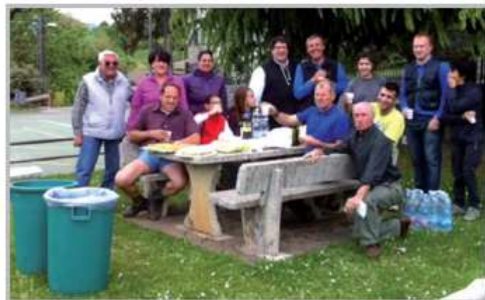
Volontari Giornata Ecologica Paese Pulito

Questo incontro ha come finalità di scoprire e valorizzare la fantasia e la creatività, abbinate dove è possibile al riciclo, all'insegna del risparmio e dell'ecologia.