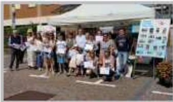
21-Aprile-22 maggio - Zogno in fiore