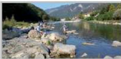
9-11 Settembre - Campionato del Mondo di Pesca alla trota