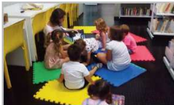
Progetto Lettura dedicato ai bambini presso la Biblioteca B. Belotti