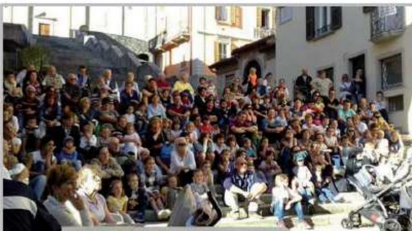
Spettacolo Burattini Compagnia "Il Riccio" - Festa della Terza Età 2016

GEMELLAGGIO FESTA AL SODALIZIO Gli amici di Zogno ospiti del circolo Salsoinsieme