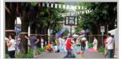
4 Settembre - Sport in Piazza