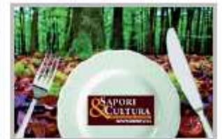
Novembre - Rassegna Sapori e Cultura