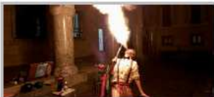
Novembre-Dicembre al sabato - We Love Shopping