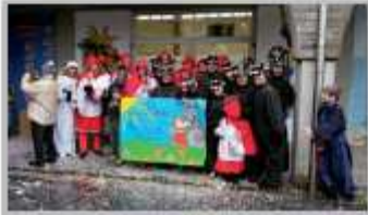
7 Febbraio - Carnevale Zognese