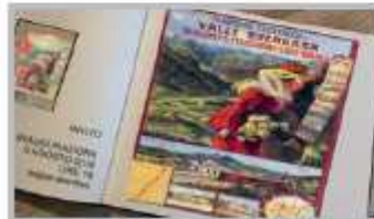
Agosto-Settembre - Mostra sulla Ferrovia di Valle