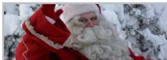
17 Dicembre - La Notte Bianca di Natale