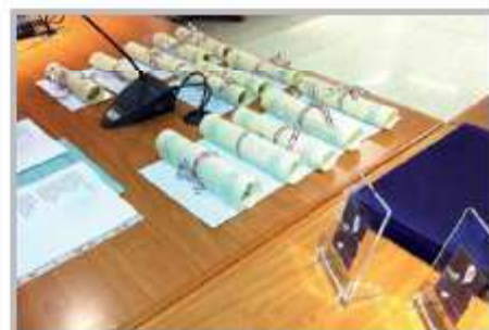
Consegna Borse di Studio per merito e premiazione eccellenze "Bortolo Belotti"

Durante la serata, l'amministrazione comunale, ha deciso di premiare alcune figure che si sono contraddistinte per merito nel nostro territorio Zognese in ambito lavorativo e sociale. Tra le persone premiate per il valore