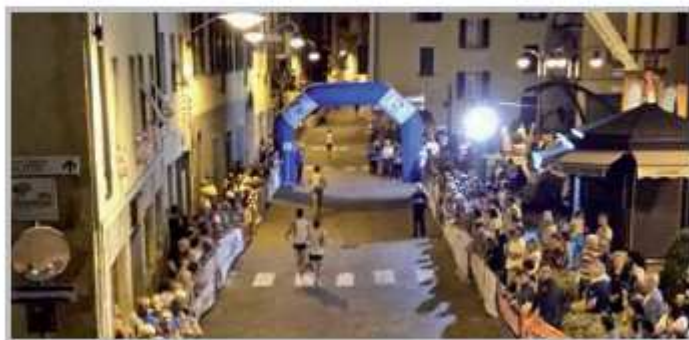
19ª Corrida di San Lorenzo