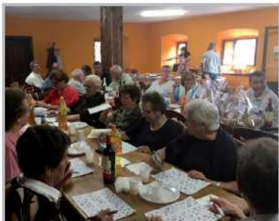
Festa delle Torte (Endenna)