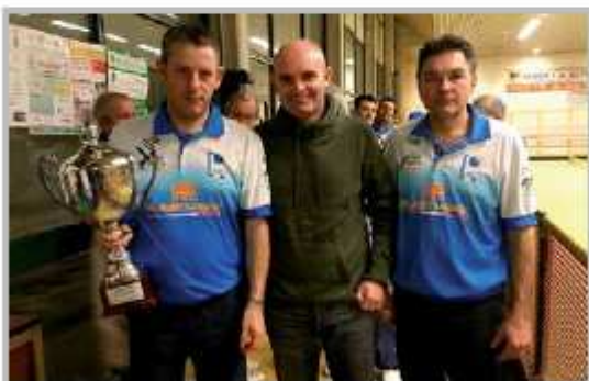
Bocce - 14° Trofeo Comune di Zogno