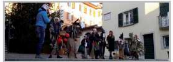
6 Gennaio - La Befana più Bella