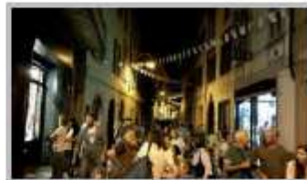
2 Luglio - Notte Bianca