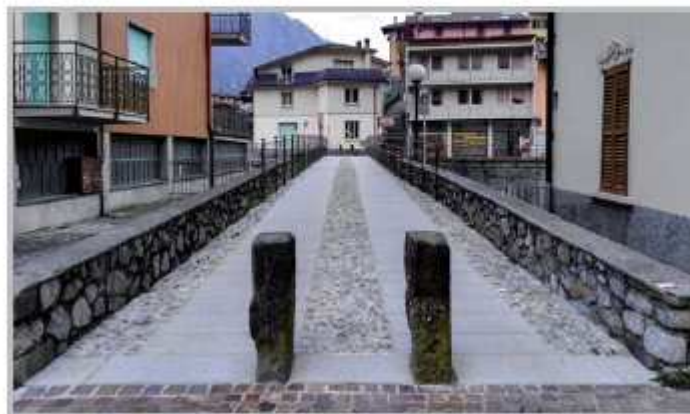
Ponte pedonale di Ambria

Il ponte carrabile è stato interessato da un importante intervento di consolidamento strutturale della banchina, che in alcuni punti, a causa del crescente traffico iniziava a mostrare segni di cedimento evidenziati da leggere rotazioni della barriera di protezione. Per il consolidamento della banchina, sono state realizzate due travi continue in calcestruzzo sui bordi collegate tra loro da elementi trasversali che impediranno ulteriori cedimenti. Si è poi scelto di sostituire le vecchie barriere in acciaio, non più adeguate a reggere eventuali urti, con murature armate in calcestruzzo, che con uno spessore molto limitato rispetto ad una barriera stradale tradizionale in acciaio, garantisce le stesse prestazioni di resistenza in caso di urto dei veicoli. Per il ponte pedonale, uno dei più vecchi presenti sul territorio zognese, si è scelto di intervenire dando priorità alla sicurezza per il transito dei pedoni, con la posa di barriere di altezza adeguata e con la realizzazione di una nuova pavimentazione rustica in pietrame. Complessivamente i tre interventi hanno comportato una spesa di 95.000,00 euro .