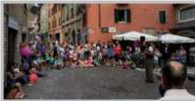
9 Agosto - Aspettando San Lorenzo