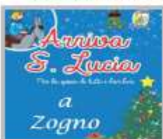
8-12 Dicembre - Santa Lucia