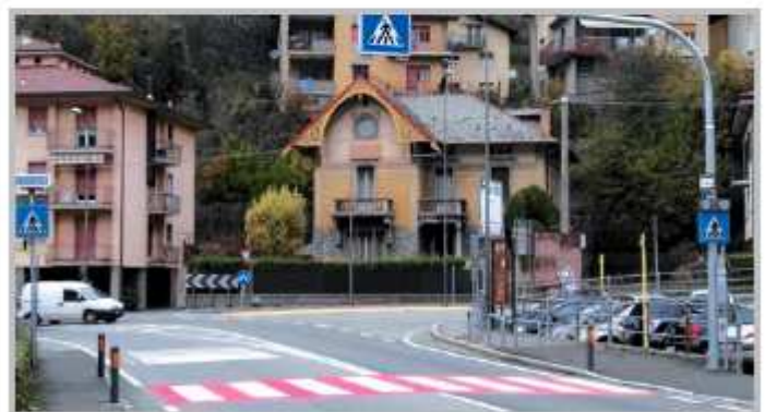
L'attraversamento pedonale in prossimità delle elementari di via Roma