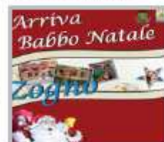
18 Dicembre Arriva Babbo Natale