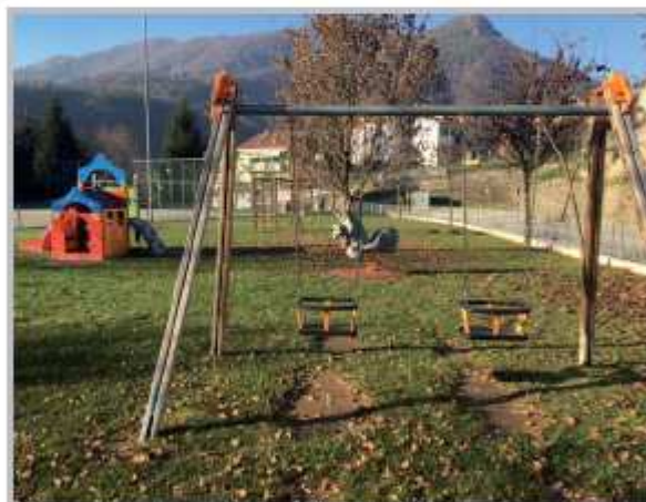
Parco giochi Endenna