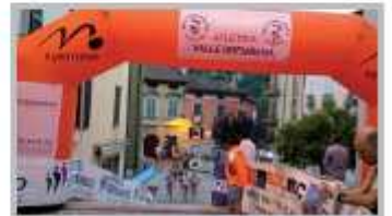
7 Agosto - 19° edizione La Corrida di San Lorenzo