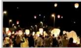
27 Agosto - Notte Bianca di fine estate