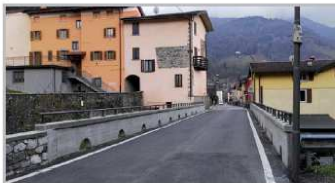
Ponte di Romacolo

Dopo l'importante intervento di recupero delle facciate delle scuole elementari di via Roma, un altro importante intervento per il miglioramento degli edifici scolastici è stato completato