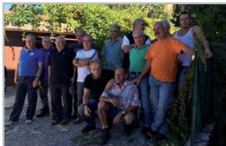
Pulizia greto del fiume Brembo