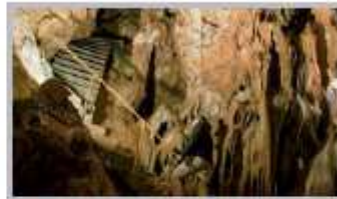
Maggio-Settembre - Grotte delle Meraviglie