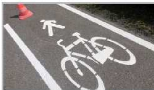
Nuova segnaletica orizzontale pista ciclopedonale