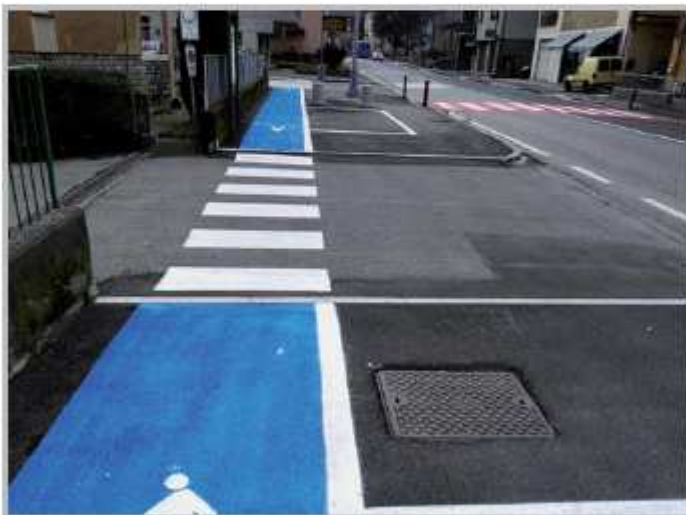
Realizzazione nuovi parcheggi via A. Locatelli

Contemporaneamente all'attuazione degli interventi sopradescritti, continua l'attività preliminare necessaria per l'attuazione degli interventi pubblici previsti nel piano di Governo del Territorio. In particolare, nel corso del 2016, dopo l'approvazione del progetto preliminare avvenuta a dicembre 2015, è stata completata la procedura di acquisizione delle aree necessarie per la realizzazione di un nuovo parcheggio con sette posti auto in località Pradelli ad Endenna . La giunta comunale ha già provveduto all'approvazione del progetto definitivo, e a breve, con il completamento del progetto esecutivo, si procederà con il completamento dell'iter necessario per dar compiuta