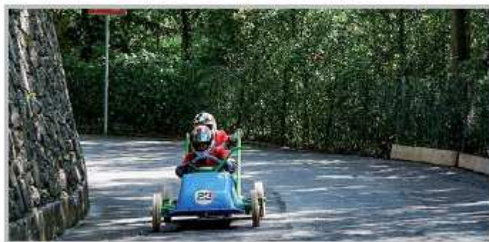
Soap Box Rally

Il 27/12 la stagione sportiva si conclude con la Serata dello Sport