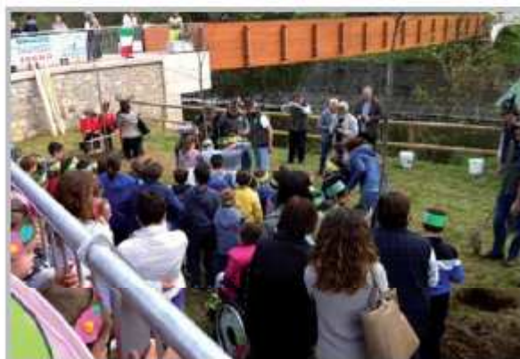
Piantumazione Festa degli alberi