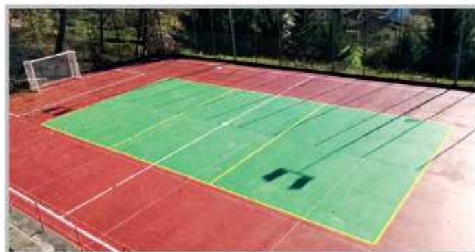
Campo da gioco polivalente Grumello