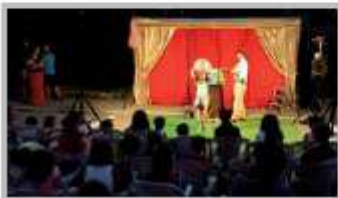
1 Luglio - Festa della Rasga