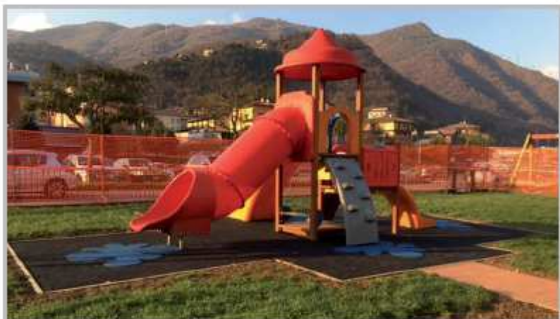
Lavori in corso al parco giochi

Nei parchi giochi, data la particolare natura degli utenti, le attrezzature ludiche necessitano di attenti controlli e verifiche perio-