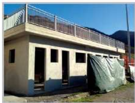
Centro sportivo Poscante

Il Palasport Comunale, utilizzato da numerose società sportive locali, è stato oggetto di un intervento di recupero energetico mediante la coibentazione della struttura che ha risolto i problemi di infiltrazioni d'acqua provenienti dall'esterno, ottenendo anche un risparmio in termini energetici (intervento finanziato con risorse comunali per euro 100.000).