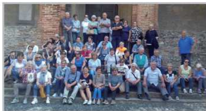
Gita a Salsomaggiore Terme e Castell'Arquato (PA)

Non poteva sicuramente mancare la tradizione festa delle Torte. Quest'anno nell'ottica tracciata gli scorsi anni di organizzare questo momento nelle frazioni, abbiamo proposto alla Comunità di Endenna questo momento che ha organizzato al meglio il pomeriggio grazie ai volontari dell'oratorio e della parrocchia.