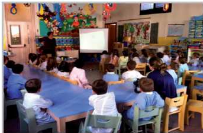
Informazione ed educazione sulla raccolta differenziata dei rifiuti