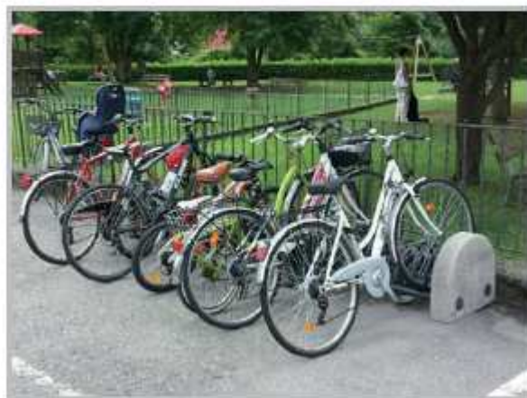
Potenziamento posti parcheggio biciclette

Il nuovo impianto d'illuminazione e il posizionamento delle telecamere di sorveglianza permetteranno un controllo sicuro dell'area giochi, contando di ridurre drasticamente anche gli atti di vandalismo.