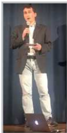
Evento sulla Teoria Gender (ottobre 2016)

Riteniamo che le parrocchie e gli oratori del nostro paese, abbiano un rilevante ruolo sociale, aggregativo e soprattutto educativo. È per questo che, laddove è possibile, cerchiamo di intraprendere insieme progetti finalizzati alla crescita culturale,