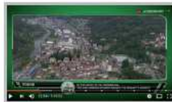
1 Ottobre - Il Lombardia