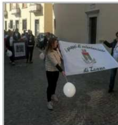
Festa del Volontariato 2016