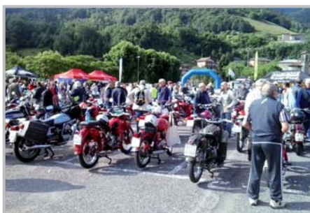
9° Raduno Moto d'epoca

Il 31/3, come vuole la tradizione, c'è stata la Casada de Màrs che ha riempito le vie del paese di persone munite di lattine, campanacci e pentole che hanno realizzato un gran baccano per scacciare (simbolicamente) la brutta stagione