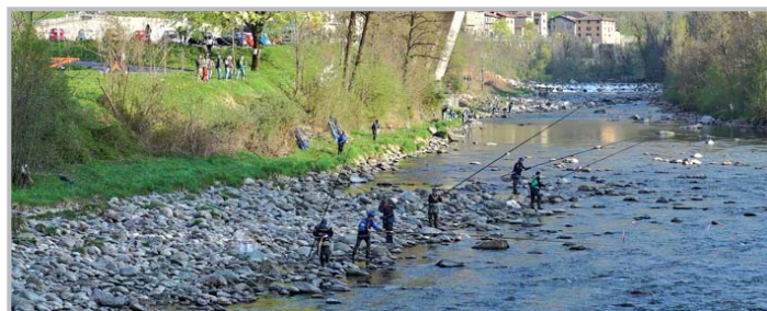
Campionato Italiano Pesca