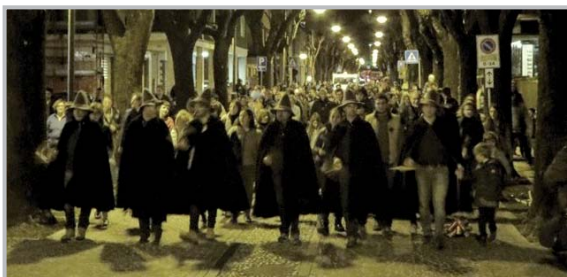
Casàda de Màrs