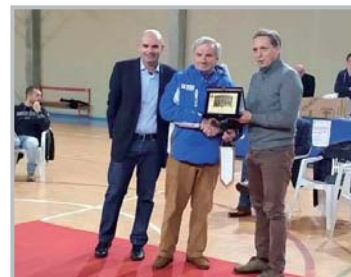
Serata dello sport