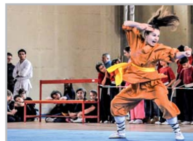
Wushu - 1° Trofeo Città di Zogno