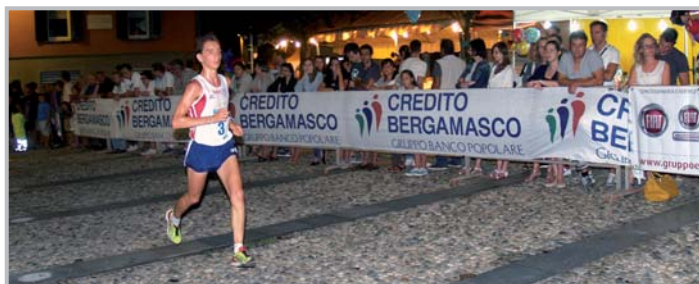
Corrida San Lorenzo

Il 9/8 la Corrida di San Lorenzo ha compiuto 18 anni! Serata fantastica: la gara di corsa su strada abbinata allo spettacolo pirotecnico ha richiamato un pubblico straripante che ha invaso le vie del paese. Le gare delle varie categorie