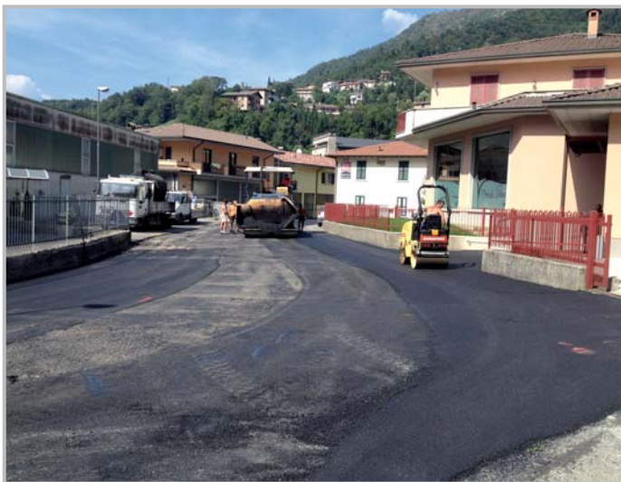
Manutenzione straordinaria pavimentazioni stradali