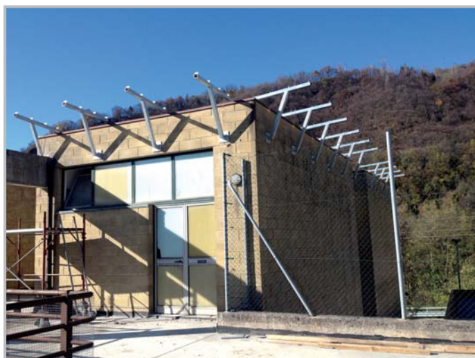
Centro sportivo Camanghè