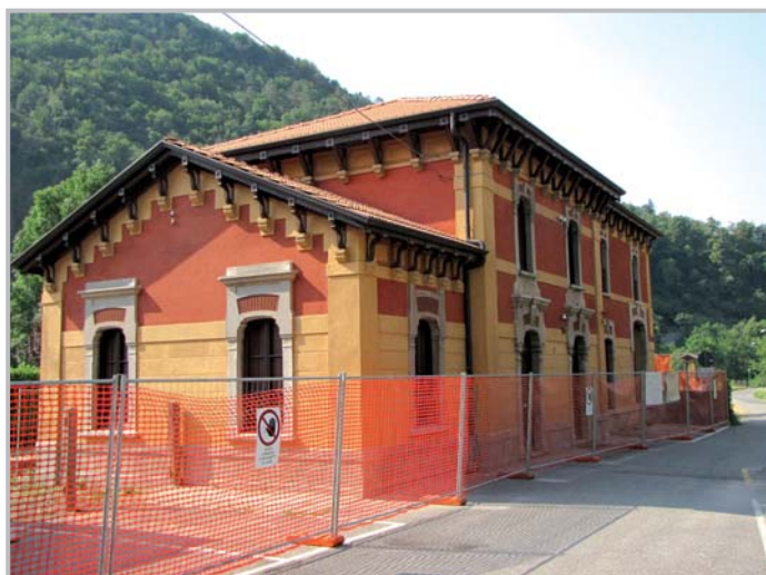
Stazione di Ambria

Un altro importante intervento, che consentirà di arricchire ulteriormente il patrimonio storico, riguarda il recupero del piano terra di villa Belotti . Fino a poche settimane fa, questi spazi, erano in parte inutilizzati ed in parte occupati da diverse attività senza elementi di continuità. Dall'estate dello scorso anno, è in corso un'importante collaborazione con l'avv. Gianluca La Villa, nipote di Bortolo Belotti, affinché Zogno diventi un importante polo di riferimento per lo studio della figura del nonno. Il primo elemento che prenderà forma nei prossimi mesi, riguarda la realizzazione di una pinacoteca che raccoglierà buona parte della collezione privata di Bortolo Belotti, con tele di elevato pregio. Il progetto di recupero prevede un sostanziale adeguamento degli spazi interni con la creazione di spazi tematici dedicati alle varie opere esposte. La centralità dell'esposizione sarà data allo studio di Bortolo Belotti, dove vengono conservati importanti documenti storici,