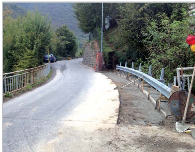
Messa in sicurezza versanti