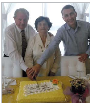
Festa della Terza Età: 2015: taglio della torta con la coppia più longeva

All'interno della famiglia, abbiamo voluto e continuiamo a realizzare eventi dedicati a chi porta la storia del nostro paese sulle spalle: i nostri anziani, veri libri di saggezza. A loro abbiamo dedicato la 19ª edizione della "Festa della Terza Età". Ho voluto citare lo scrittore francese Marc Levy che dice "Le rughe della vecchiaia formano le più belle scritture della vita, quelle sulle quali i bambini imparano a leggere i loro sogni", nel ringraziare quella fascia di persone che ormai occupano un ruolo sociale a supporto della famiglia. Nonni vigili, Nonni baby sitter, Nonni cuochi e tanti altri ruoli all'interno della famiglia che i nostri cari nonni svolgono. Quest'anno la Festa della Terza Età, è stata organizzata con alcuni elementi innovativi: gli appuntamenti non si sono più concentrati in una sola settimana, ma hanno creato un percorso di feste e momenti aggregativi nel mese di settembre che si sono conclusi il 2 di ottobre, proprio il giorno della Festa dei Nonni. Inoltre alcuni incontri sono stati svolti nelle frazioni: abbiamo toccato la comunità di Stabello con il raduno provinciale dei gruppi di Cammino (percorso EXPO 2015) e la comunità di Poscante con la tradizionale Festa delle Torte e pomeriggio musicale. Una