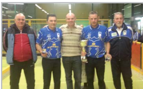
Bocce - 13° Trofeo Comune Zogno