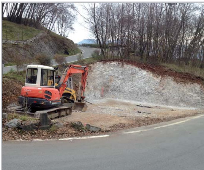
Nuovo parcheggio al bivio per Carubbo

via Molino e in via Braga a Poscante , in prosecuzione degli interventi di messa in sicurezza del territorio già iniziati negli anni precedenti. Per questi interventi è prevista una spesa di circa 80.000,00 euro .