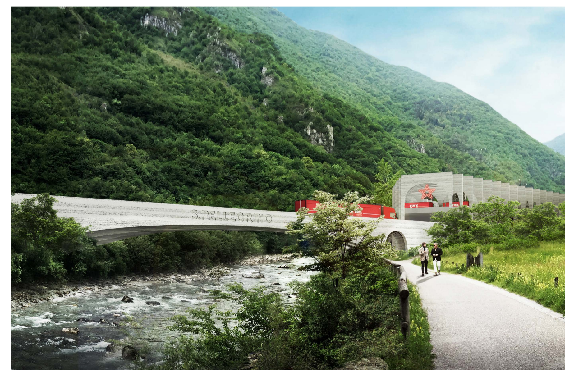
2 VISTA DALLA CICLABILE