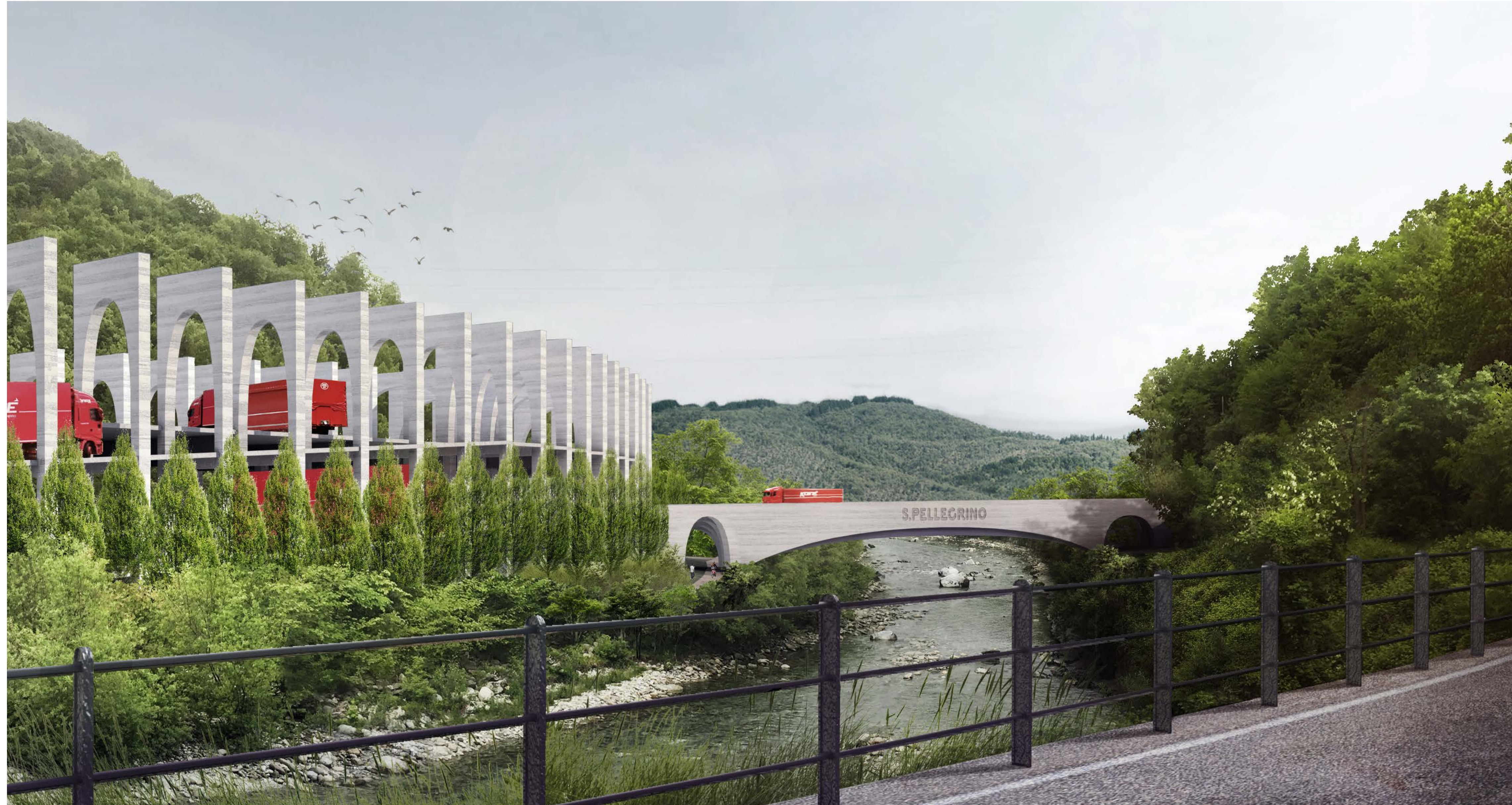
3 VISTA DA NORD