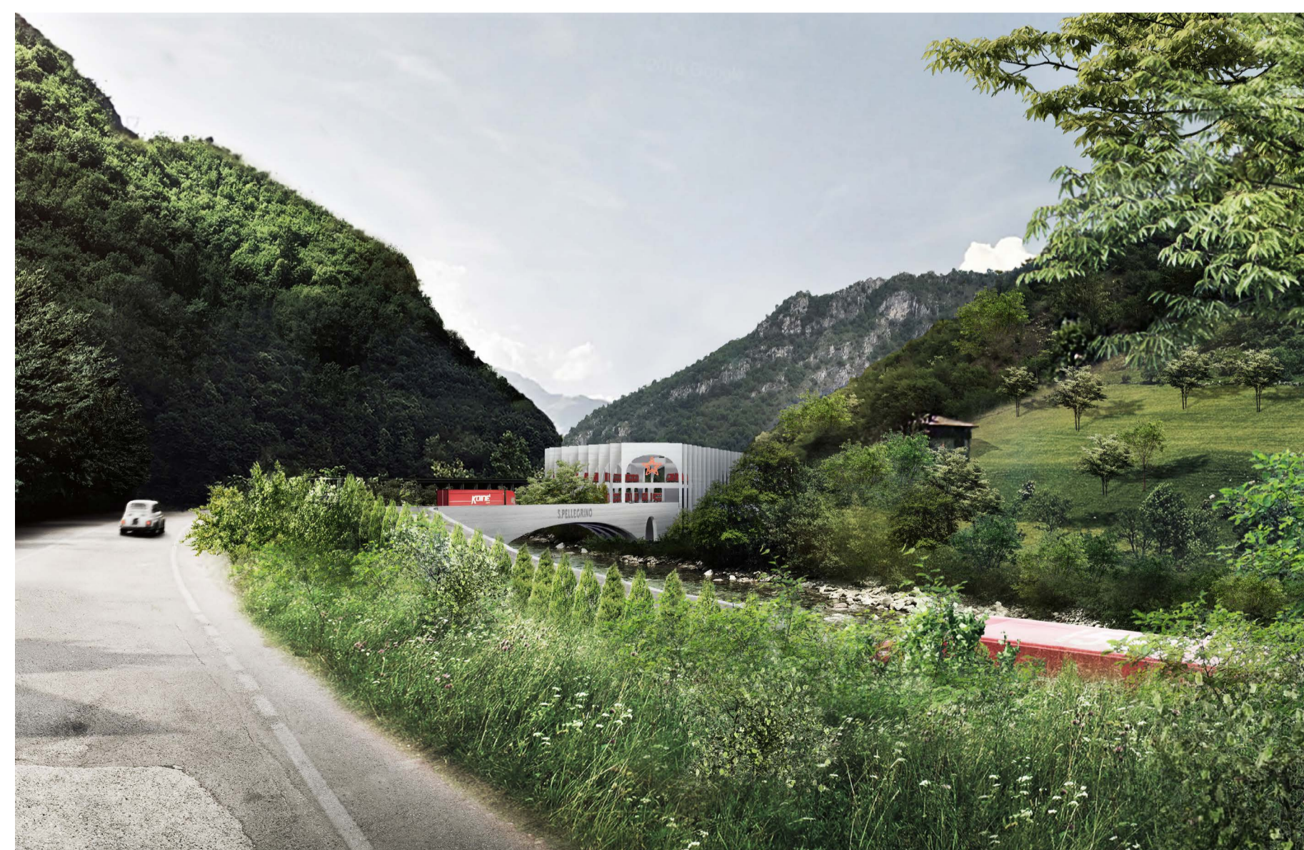
1 VISTA DA SUD