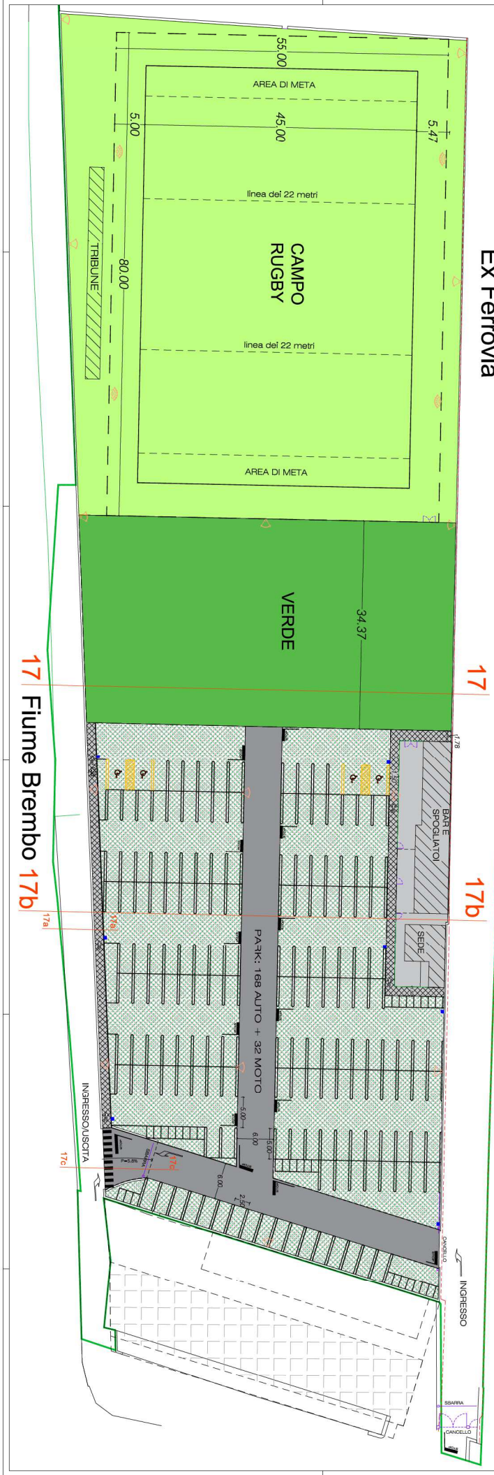
17 Fiume Brembo 17b