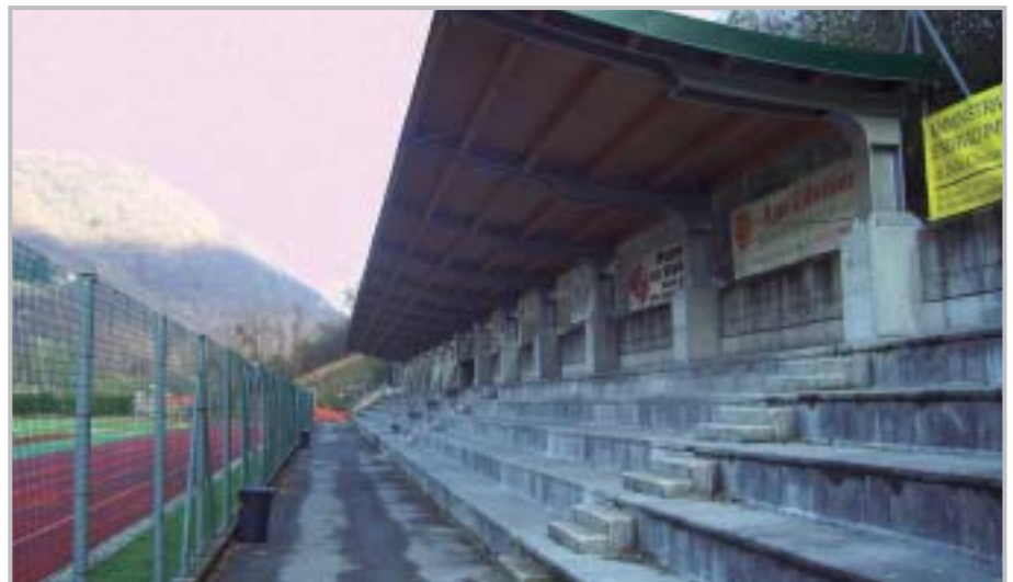
Copertura Tribune Centro Sportivo Comunale

cessarie. Proprio in questi giorni è iniziata, dopo l'affidamento dell'incarico, la progettazione dell'intervento per la rettifica stradale con la realizzazione di alcuni posti auto in via Costa Berlendis a Somendenna ; l'intervento, con una spesa presunta di 150.000€, prevede pertanto la realizzazione di alcuni nuovi posti auto e la transitabilità della strada, oltre alle autovetture dei residenti, ai mezzi di soccorso come le ambulanze. Già finanziati con un importo di 150.000€ sono i lavori di completamento e riqualificazione al Centro Sportivo Comunale di Camanghè , dove si andrà a realizzare un nuovo locale per il deposito degli attrezzi sportivi, rifare la pavimentazione e a sistemare alcuni tratti di copertura della palestra. Con un'operazione di tipo pubblico-privato è in fase di progettazione il completamento della strada di accesso alla Contrada di San Cipriano .