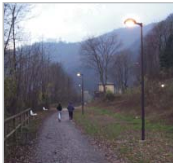
Illuminazione Pista Ciclopedonale