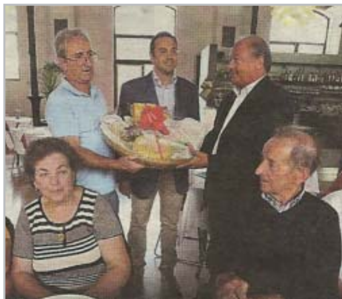
Gita a Verona: l'incontro con l'Amministrazione

La settimana della "terza età" giunta quest'anno alla 13ª edizione è diventata un appuntamento entrato nella tradizione della comunità zognese.