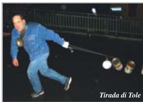
Tirada di Tole

Carnevale: Sfilata per le vie del paese con una cornice di pubblico considerevole lungo il percorso e presso l'Oratorio. Il Carnevale rappresenta da sempre un momento di gioia in grado di trascinare bambini ed adulti rispolverando tradizioni consolidate nel tempo.