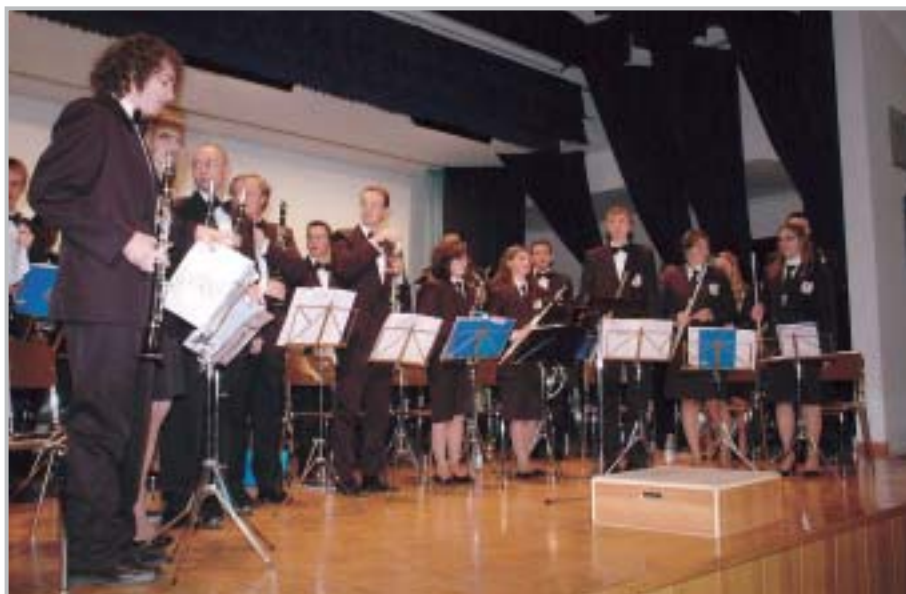
Premiata Banda Musicale di Zogno

Concerti con il coro Fior di Monte sono stati eseguiti nelle chiese di Endenna e di Zogno, mentre la Premiata Banda Musicale di Zogno ha suonato ad Ambria, a Poscante, al concerto di San Lorenzo e Santa Cecilia e nelle processioni liturgiche patronali. A fine maggio in piazza Garibaldi si è tenuto il concerto "strumenti e racconti popolari zognesi" con il Gruppo Studio Musica Popolare. Successo tra bambini ed adulti è stato raccolto dalla compagnia "Il Riccio" con le esilaranti storie del Giùpi, ad Ambria, a Miragolo San Marco e Stabello. Il gruppo Color Sound ha presentato