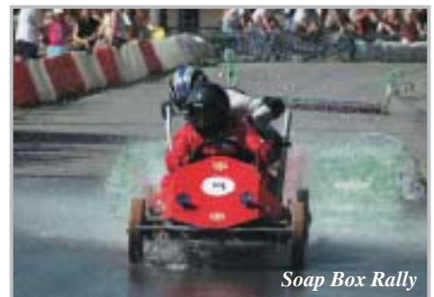
Soap Box Rally