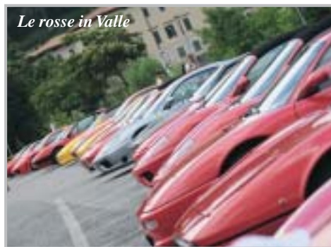
Le rosse in Valle

Le Rosse in Valle: Classico raduno delle FERRARI con 60 bolidi presso