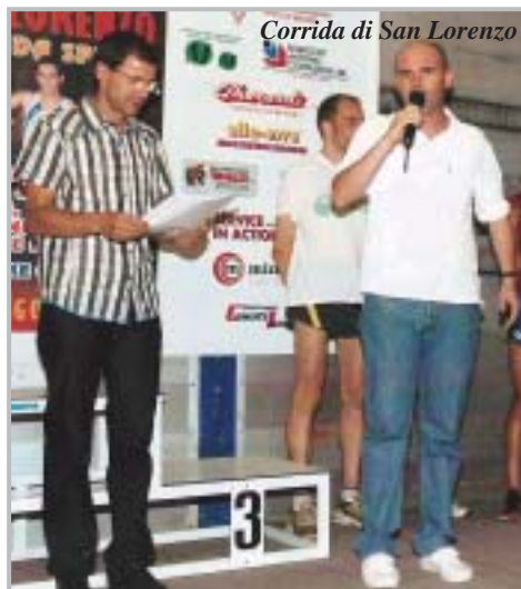
Corrida di San Lorenzo