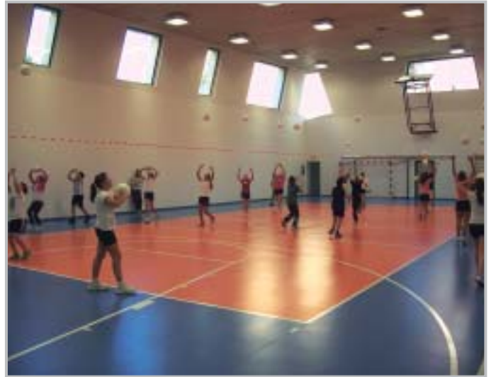
Nuova Palestra Scuole Medie - Interno

giudicataria del bando per la gestione calore degli edifici Comunali effettuato lo scorso anno; l'offerta prevedeva oltre alla gestione in toto degli impianti per nove anni, la sostituzione di tutte le vecchie caldaie , con caldaie a risparmio energetico di tipo a condensazione, la modifica degli impianti delle scuole di Endenna e di via San Bernardino alimentati ancora a gasolio con impianti a metano, la realizzazione di due impianti fotovoltaici, due impianti di pannelli solari termici, un sistema di riscaldamento a sonde geotermiche con pompa di calore ; inoltre tutti gli impianti saranno dotati di sistema di telecontrollo . Tranne gli impianti fotovoltaici, per i quali abbiamo inoltrato la richiesta di finanziamento su un bando regionale, tutti questi impianti sono stati già installati e attivati.