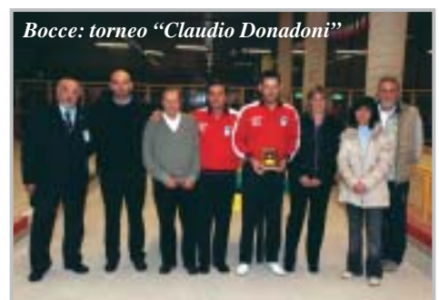
Bocce: torneo "Claudio Donadoni"