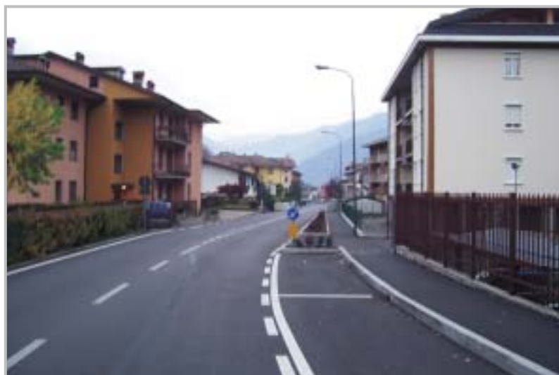
Via Degli Alpini

Con un finanziamento statale e con una spesa complessiva di 575.000€ sono stati ultimati i lavori per la realizzazione della rotatoria al Ponte Nuovo , dove si è andati a curare anche i dettagli estetici e funzionali di un'opera che ha apportato dei benefici, a posteriori riconosciuti da tutti, alla viabilità vallare e, come era più facilmente intuibile, a quella laterale di innesto e comunque migliorando una situazione di immobilità che durava da decenni. Questo non deve però distogliere l'attenzione dalla Variante di Zogno in galleria, unica e vera risoluzione della viabilità vallare. L'area della rotatoria è