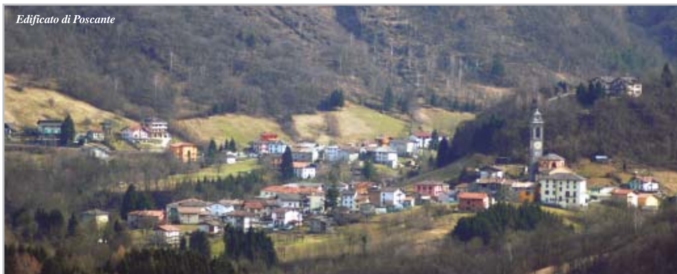
Edificato di Poscante

Mentre per i privati cittadini, come indicano le normative, dai benefici del Piano Casa, saranno esclusi i centri storici anche di piccole dimensioni, fatta eccezione per i casi di ristrutturazione di edifici cadenti, saranno invece possibili ampliamenti di edifici rurali dimessi, già individuati nel P.R.G.. Le altre aree vedono la piena attuazione del Piano Casa nei limiti imposti dalla legge e dalle scelte di tutela del territorio e del paesaggio. Peraltro nel Piano Regolatore generale di Zogno, sono già previste norme che anticipano i contenuti della legge 13. Novità assoluta sta, invece, negli sconti sugli oneri di urbanizzazione per gli ampliamenti di edifici produttivi, la misura vuole essere un segnale concreto di contrasto alla crisi e di sostegno all'occupazione. Per ulteriori informazioni dettagliate invitiamo tutti i cittadini a consultare il sito web comunale nella sezione Piano casa.