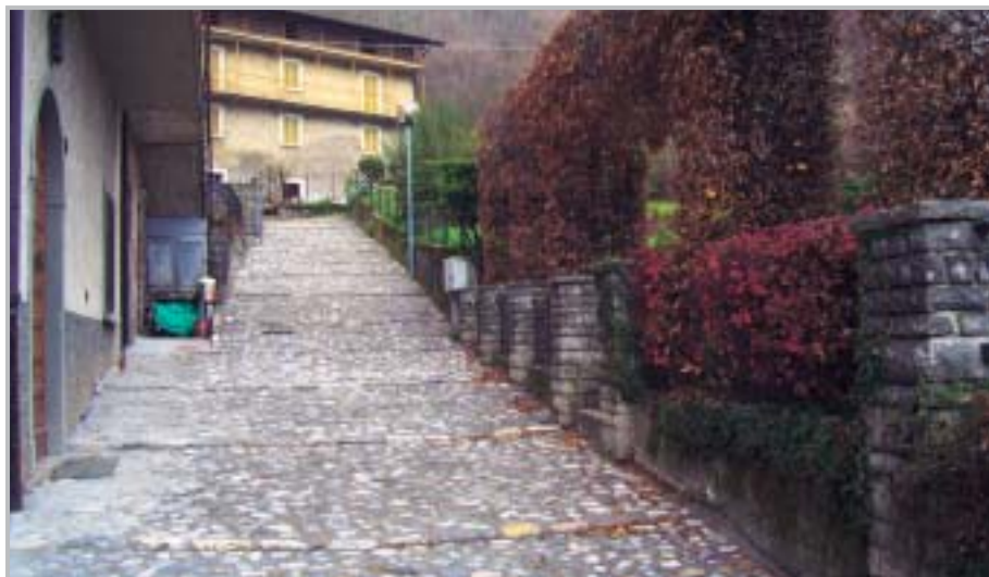
Mulattiera Via Tessi Spino al Brembo

Anche se non indicato nella tabella riassuntiva delle opere in corso, è bene evidenziare che sono stati pressoché ultimati i lavori previsti nell'offerta della ditta ag-