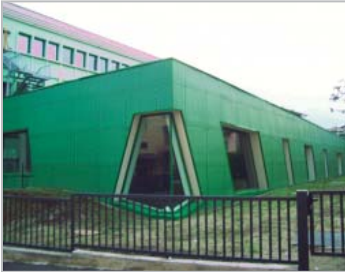
Nuova Palestra Scuole Medie - Esterno