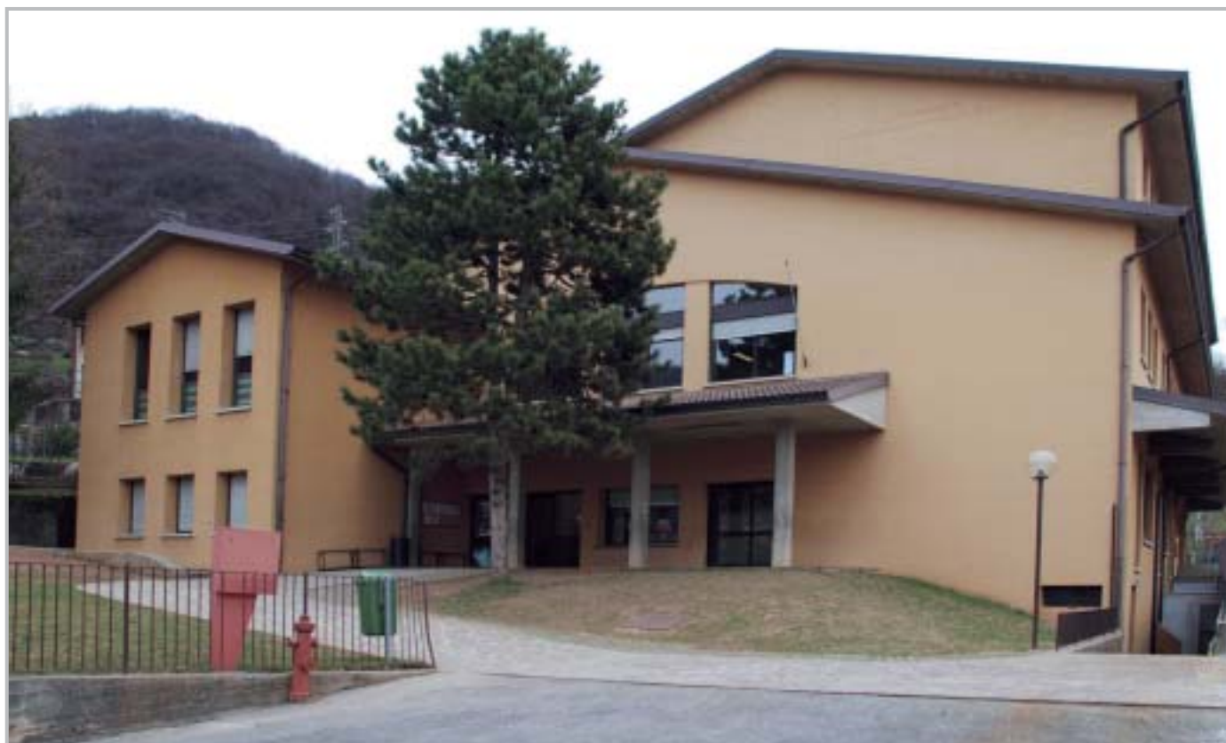
La scuola di Endenna