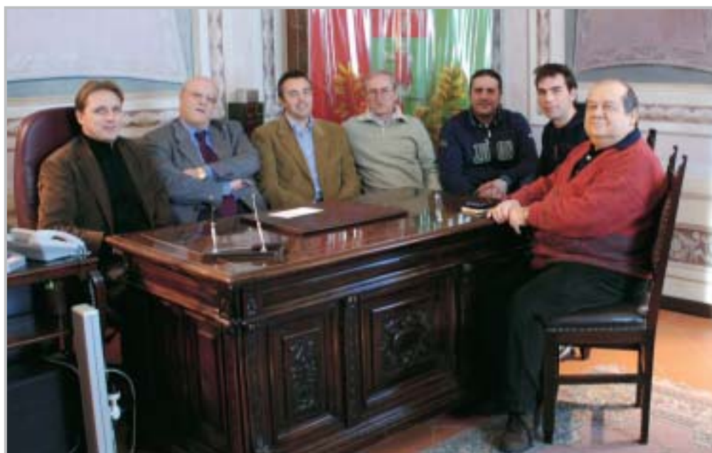
Il Sindaco e la Giunta